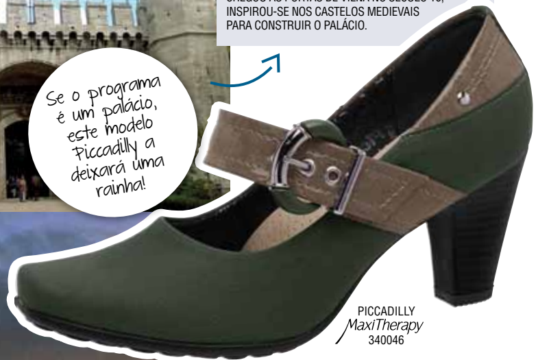
PICCADILLY MaxiTherapy 340046

Se o programa é um palácio, este modelo Piccadilly a deixará uma rainha!