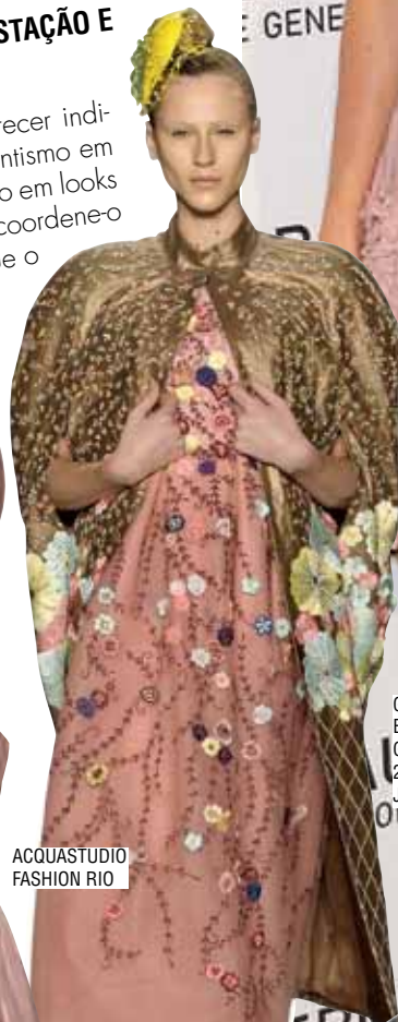
ACQUASTUDIO FASHION RIO

Também conhecido como rosa-antigo, o malva pode parecer indicado somente para aquelas que têm em seu estilo o romantismo em primeiro plano, mas isso não é verdade; ele pode ser usado em looks descolados, clássicos e até modernos. Invista no tom, coordene-o com nude, preto, cinza, azul ou jeans e prove a todos que o rosa-antigo é superatual!