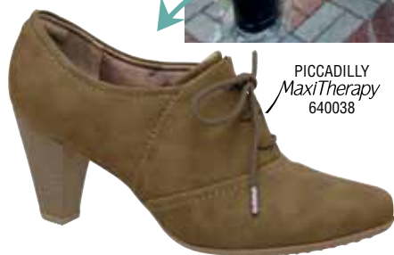
PICCADILLY MaxiTherapy 640038

ALESSANDRA MACEDO CALÇA TNG BÁSICA COLCCI COLETE BRECHÓ LENÇO FARM ÓCULOS VINTAGE FREE'P'STAR BOLSA MARISA PICCADILLY MAXITHERAPY 640038