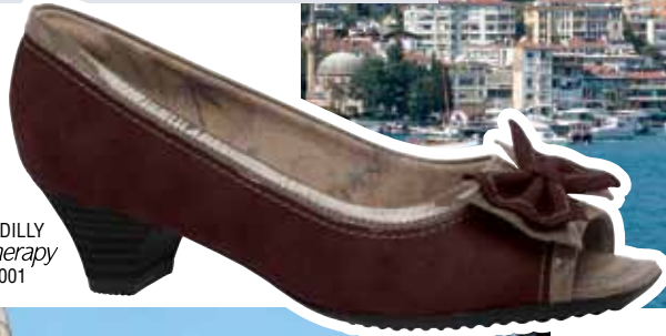
PICCADILLY MaxiTherapy 713001

OS PASSEIOS DE BARCOS PELO ESTREITO DE BÓSFORO SÃO ÓTIMAS OPÇÕES PARA QUEM QUER CURTIR CADA ATRAÇÃO DA CIDADE. É POSSÍVEL ADMIRAR O LADO OCIDENTAL E ORIENTAL DE UM ÂNGULO PRIVILEGIADO.