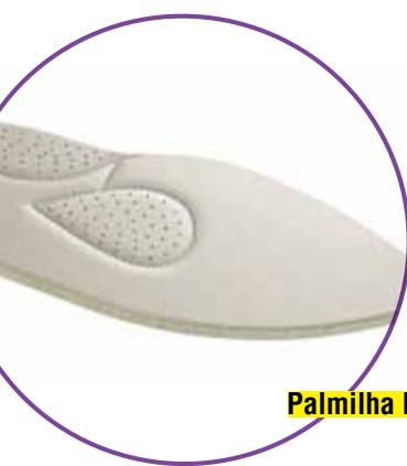
Palmilha PU* (Gotas Espuma)

O contato direto entre seus pés e o calçado deve ser superconfortável e é por isso que as palmilhas internas dos calçados fechados da Piccadilly são feitas com 5 mm de espessura e gotas de espuma. Elas estão localizadas estrategicamente para massagear seus pés durante o caminhar. Outro ponto forte desta palmilha é o fato dela ser desenvolvida em material de PU* transpirante e tratamento bactericida e fungicida.