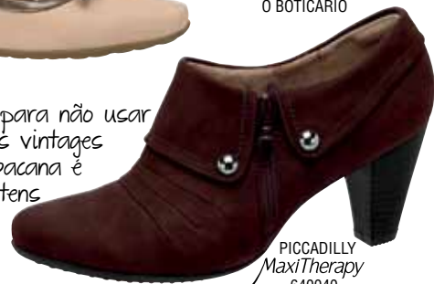
PICCADILLY MaxiTherapy 640040

3 Fique atenta para não usar somente peças vintage ou retrôs. O bacana é mesclar com itens moderninhos.