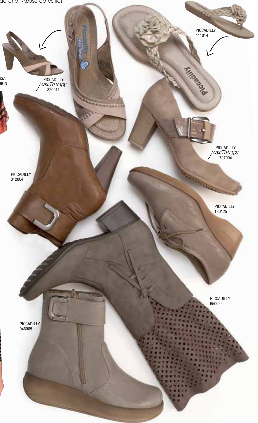
PICCADILLY MaxiTherapy 820011