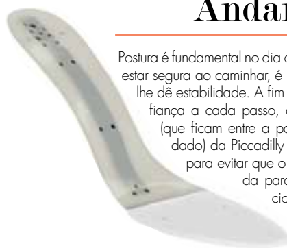
Palmilha de montagem

Postura é fundamental no dia a dia e para que você possa estar segura ao caminhar, é necessário que seu calçado lhe dê estabilidade. A fim de garantir ainda mais confiança a cada passo, as palmilhas de montagem (que ficam entre a palmilha de espuma e o solado) da Piccadilly são feitas de aço dentado, para evitar que o salto despregueela é injetada para ser mais rígida e proporcionar maior segurança e estabilidade. Além disso, garantem mais resistência e estabilidade.