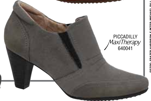
PICCADILLY MaxiTherapy 640041

TOMMY HILFIGER MERCEDES-BENZ FASHION WEEK