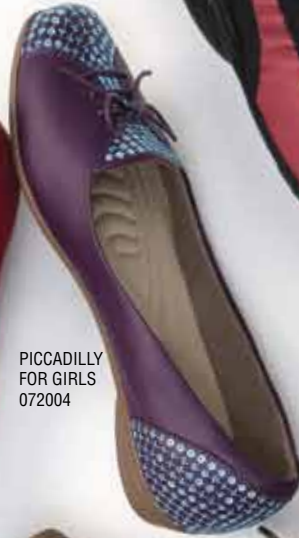
PICCADILLY FOR GIRLS 072004