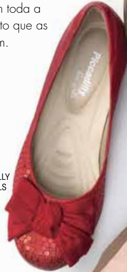
PICCADILLY FOR GIRLS 070001