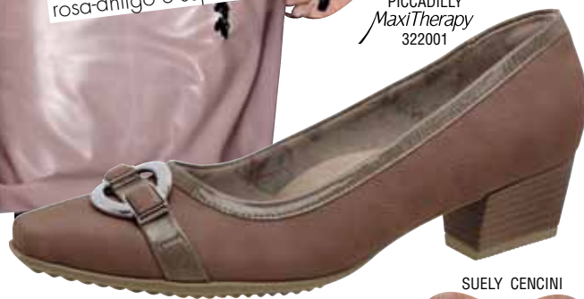
PICCADILLY MaxiTherapy 322001