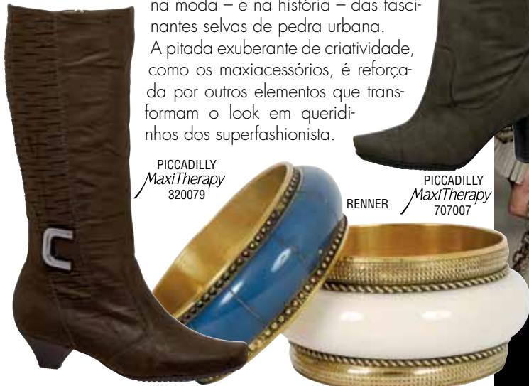
PICCADILLY MaxiTherapy 320079