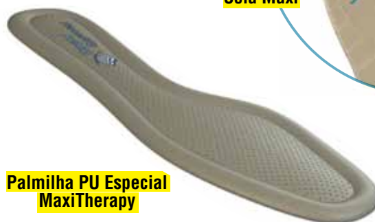
Palmilha PU Especial MaxiTherapy