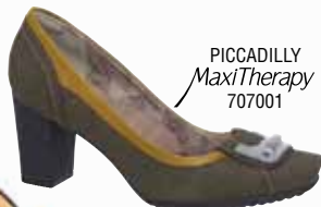
PICCADILLY MaxiTherapy 707001