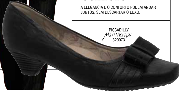
PICCADILLY MaxiTherapy 320073

A ELEGÂNCIA E O CONFORTO PODEM ANDAR JUNTOS, SEM DESCARTAR O LUXO.