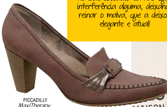
PICCADILLY MaxiTherapy 315034

Gwyneth Paltrow, famosa por seu talento e charme no red carpet é adepta do tom e no look escolhido ela não quis interferência alguma, deixando reinar o malva, que a deixou elegante e atual!