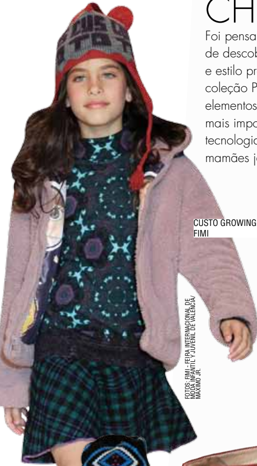
CUSTO GROWING FIMI

Foi pensando nessa menina atual, que gosta de descobertas, tem personalidade forte e estilo próprio, que foi criada a nova coleção Piccadilly For Girls, repleta de elementos modernos e estilosos. E o mais importante, com toda a tecnologia do conforto que as mamães já conhecem.