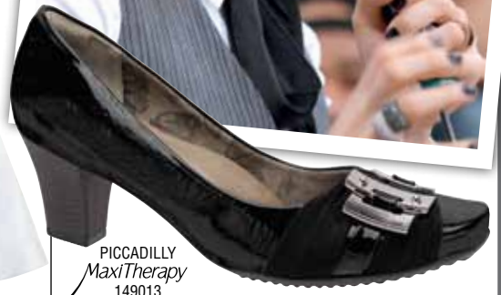
PICCADILLY MaxiTherapy 149013