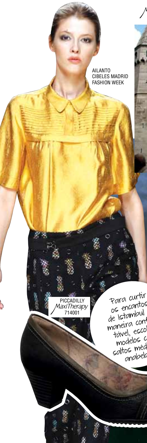
AILANTO CIBELES MADRID FASHION WEEK

A maior cidade da Turquia encanta a todos por suas influências ocidentais e orientais, já que é a única do mundo que fica em dois continentes: Europa e Ásia. É cortada pelo estreito de Bósforo, que une o Mar de Marmara (parte do Mediterrâneo) ao Mar Negro. Seus minaretes a tornam uma das cidades mais fascinantes do mundo. Quem visita Istambul não a esquece, jamais!