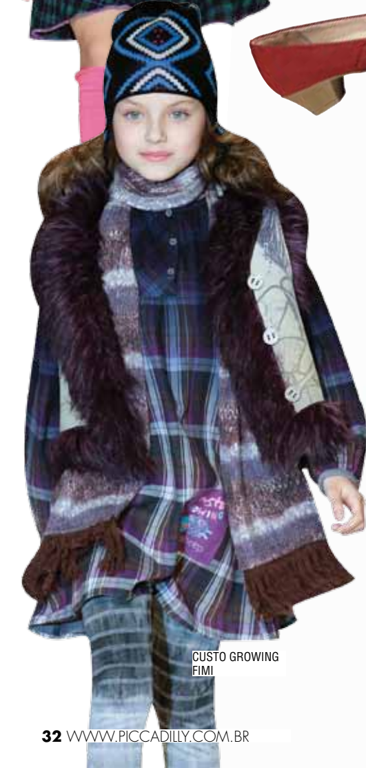
CUSTO GROWING FIMI