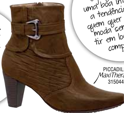
PICCADILLY MaxiTherapy 315044

O efeito amassado é um "que" a mais na produção, por isso o ideal é que ele seja usado numa única peça. Assim, ele terá ainda mais destaque!