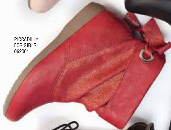
PICCADILLY FOR GIRLS 062001