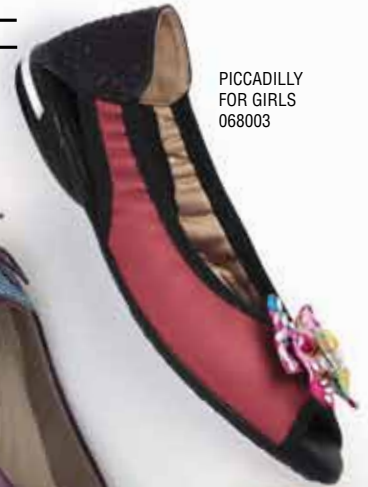
PICCADILLY FOR GIRLS 068003