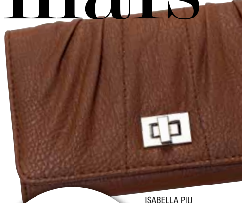
ISABELLA PIU BY XERYUS

Na coleção Piccadilly, botas, de cano alto e curto, além de scarpins, são daqueles itens que não podem faltar em nossas produções. Invista no efeito amassado, já que na próxima estação ele será essencial!