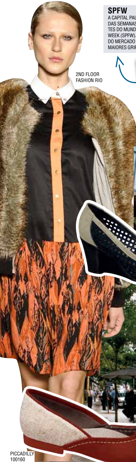
2ND FLOOR FASHION RIO

Cosmopolita, intensa e globalizada, a sexta maior cidade do planeta abriga uma vasta diversidade cultural em que os estilos se misturam e se fundem num conglomerado de vivências.