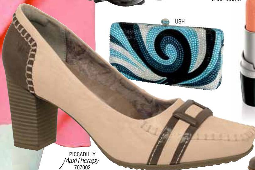
PICCADILLY MaxiTherapy 707002