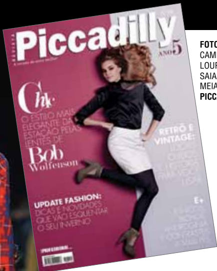
FOTO DE CAPA: CAMISA REINALDO LOURENÇO SAIA ELLUS MEIA-CALÇA TRIFIL PICCADILLY 803036