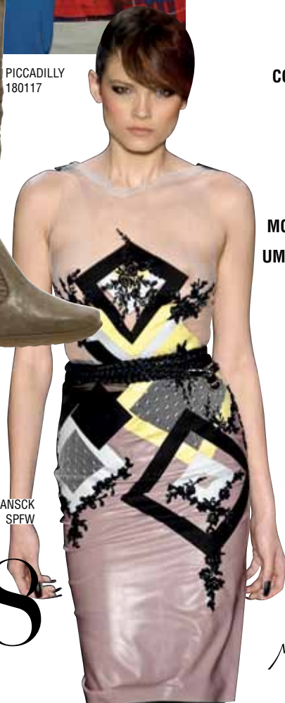
SAMUEL CIRNANSCK SPFW