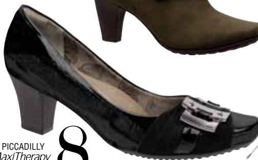
PICCADILLY MaxiTherapy 149013