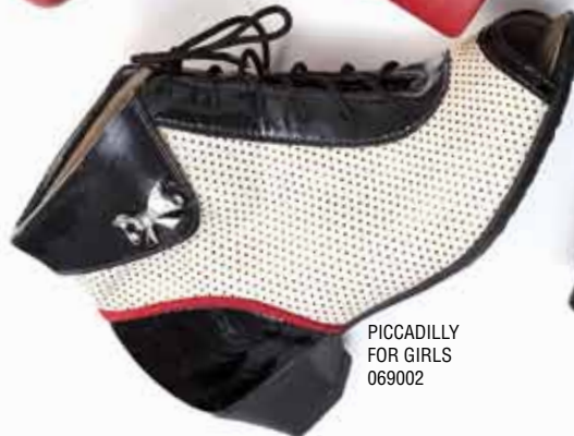
PICCADILLY FOR GIRLS 069002