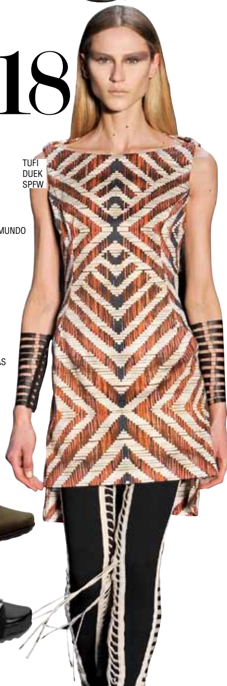
TUFI DUEK SPFW