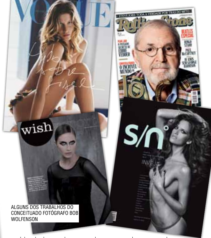
ALGUNS DOS TRABALHOS DO CONCEITUADO FOTÓGRAFO BOB WOLFENSON

A experiência internacional deu-lhe a oportunidade de abrir novas perspectivas de trabalho e, de volta ao Brasil, consagrou-se então como um dos grandes nomes da fotografia de moda