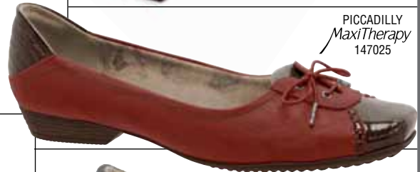
PICCADILLY MaxiTherapy 147025