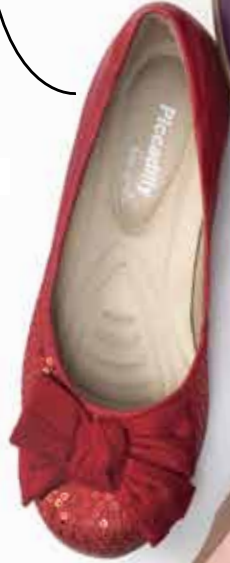
PICCADILLY FOR GIRLS 070001