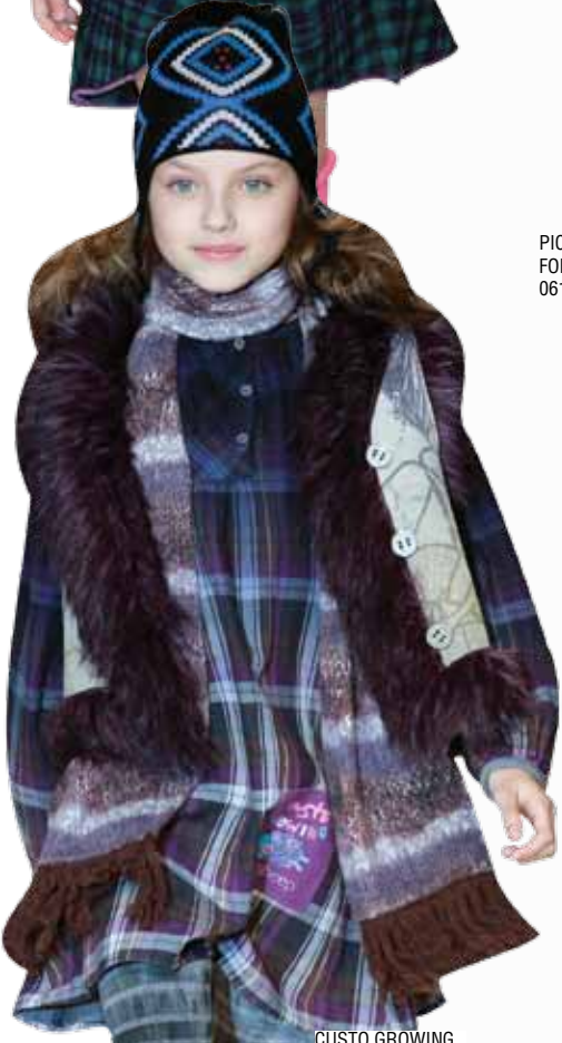
CUSTO GROWING FIMI