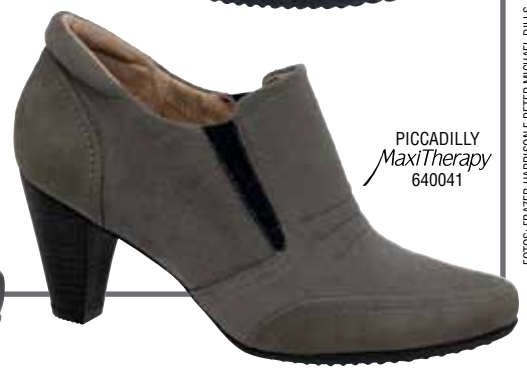
PICCADILLY MaxiTherapy 640041

TOMMY HILFIGER MERCEDES-BENZ FASHION WEEK NEW YORK