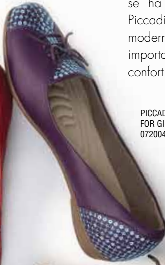
PICCADILLY FOR GIRLS 072004