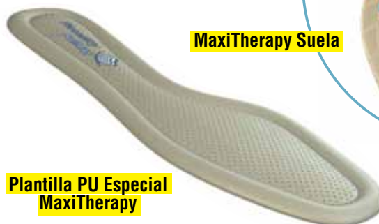
Plantilla PU Especial MaxiTherapy

Los calzados cerrados de la línea MaxiTherapy tienen una espuma especial embutida en la parte trasera del talón de los modelos, lo que proporciona todavía más comodidad. Toda esa suavidad evita ampollas y asegura sensaciones agradables de mayor comodidad, principalmente en esa región tan sensible de los pies.