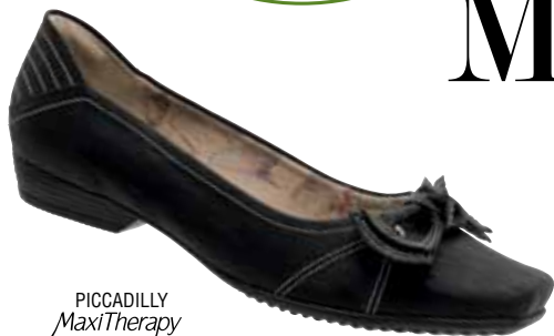
PICCADILLY MaxiTherapy 147023