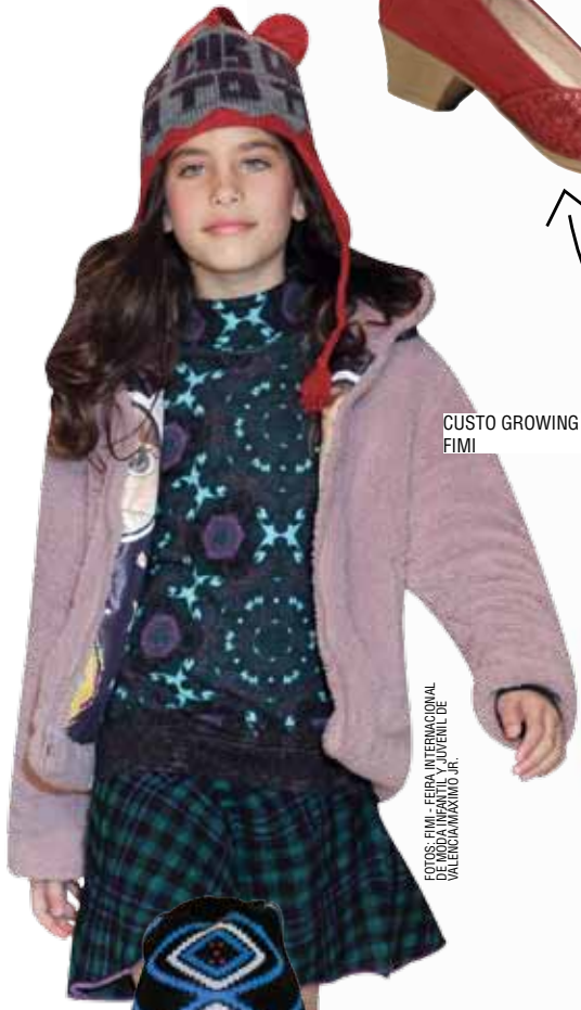
CUSTO GROWING FIMI

Pensando en la chica actual, a quien le gusta descubrir cosas, que tiene personalidad fuerte y estilo propio, se ha creado la nueva colección Piccadilly For Girls, llena de elementos modernos y con mucho estilo. Y lo más importante: con toda la tecnología del confort que las mamás ya conocen.