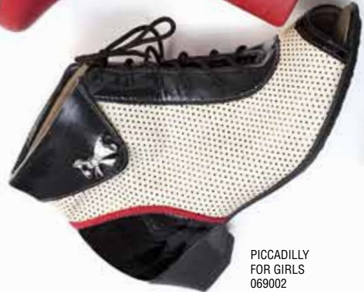
PICCADILLY FOR GIRLS 069002