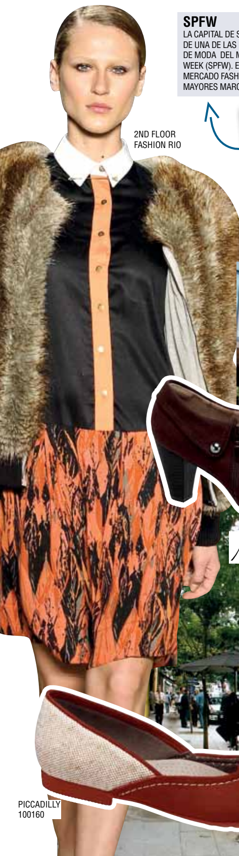
2ND FLOOR FASHION RIO

Cosmopolita, intensa y globalizada, la sexta mayor ciudad del planeta abriga una vasta diversidad cultural en que se mezclan y se funden los estilos en un conglomerado de experiencias.