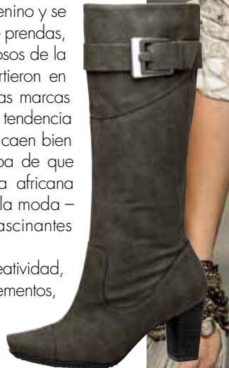
PICCADILLY MaxiTherapy 707007