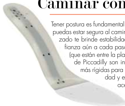
Plantilla de montaje inyectada

Tener postura es fundamental en el cotidiano y para que puedas estar segura al caminar, es necesario que tu calzado te brinde estabilidad. Para asegurar más confianza aún a cada paso, las plantillas de montaje (que están entre la plantilla de espuma y la suela) de Piccadilly son inyectadas, lo que las hace más rígidas para proporcionar mayor seguridad y estabilidad. Tienen alma de acero con dientes para evitar que se suelte el tacón.