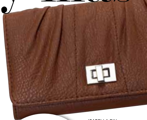
ISABELLA PIU BY XERYUS

¡Invierte en el efecto arrugado pues será esencial en la próxima estación!