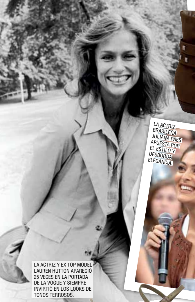
LA ACTRIZ Y EX TOP MODEL LAUREN HUTTON APARECIÓ 25 VECES EN LA PORTADA DE LA VOGUE Y SIEMPRE INVIRTIÓ EN LOS LOOKS DE TONOS TERROSOS.