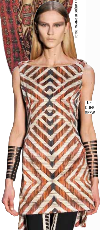
TUFI DUEK SPFW