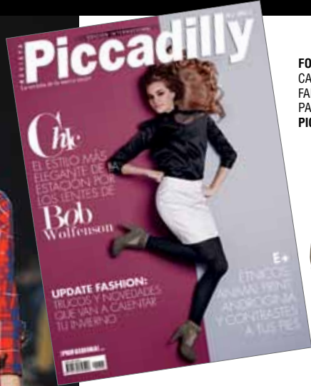
CAMISA: REINALDO LOURENÇO FALDA: ELLUS PANTIMEDIA TRIFIL PICCADILLY 803036