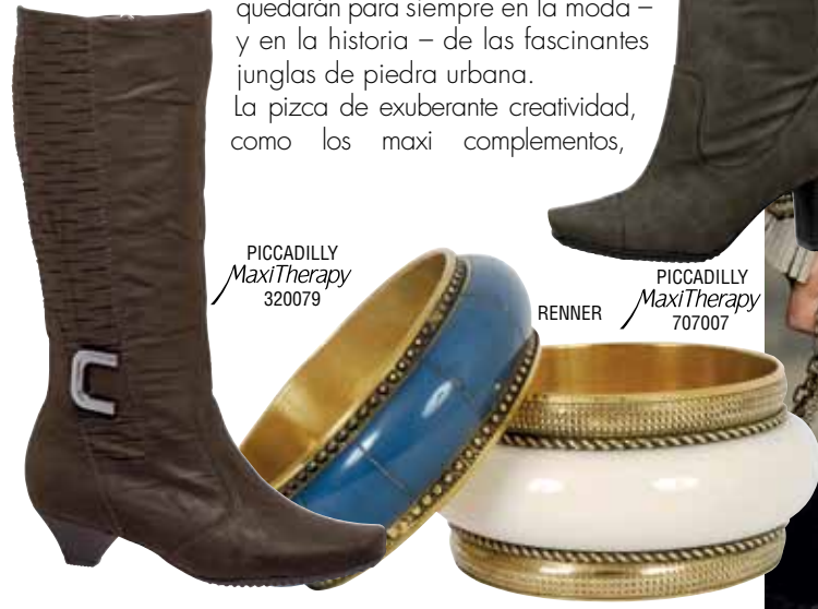
PICCADILLY MaxiTherapy 320079