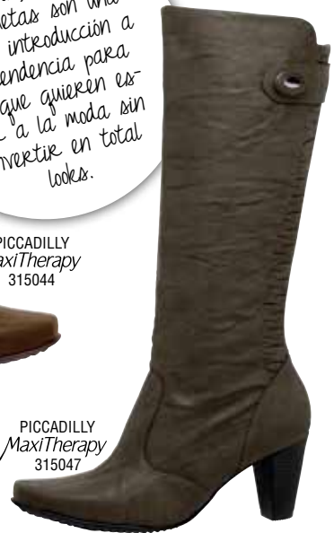
PICCADILLY MaxiTherapy 315047