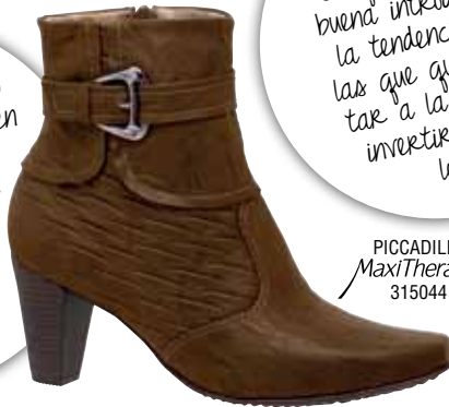
PICCADILLY MaxiTherapy 315044

El efecto arrugado es un detalle más en la producción, por ello lo ideal es que lo uses en una única pieza. ¡Así tendrá aún más destaque!