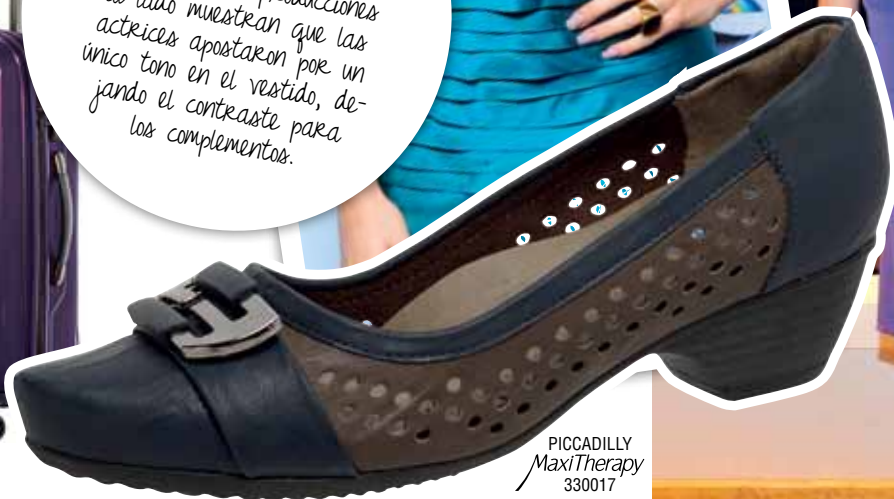
PICCADILLY MaxiTherapy 330017