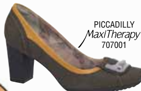
PICCADILLY MaxiTherapy 707001