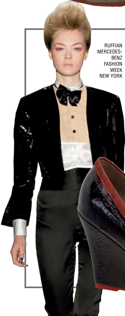
RUFFIAN MERCEDES-BENZ FASHION WEEK NEW YORK