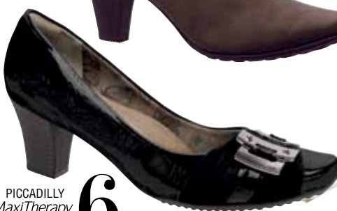
PICCADILLY MaxiTherapy 149013