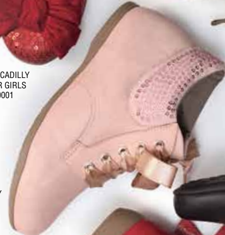
PICCADILLY FOR GIRLS 061006