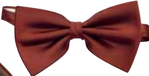
À LA GARÇONNE

INNOVACIÓN Y ACTITUD SON FUNDAMENTALES PARA UN LOOK MÁS NOVEDOSO.