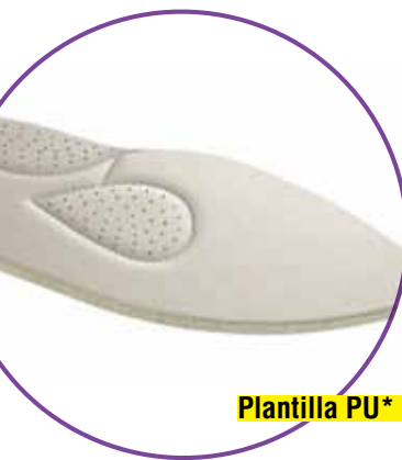
Plantilla PU* (Gotículas Espuma)

El contacto directo entre tus pies y el calzado debe ser súper cómodo y por eso las plantillas internas de los calzados cerrados de Piccadilly se hacen con 5 mm de espesor y gotículas de espuma. Se ubican estratégicamente para masajear tus pies durante el caminar. Otro punto fuerte de esta plantilla es que está desarrollada en material de PU* transpirante y tiene tratamiento bactericida y fungicida.