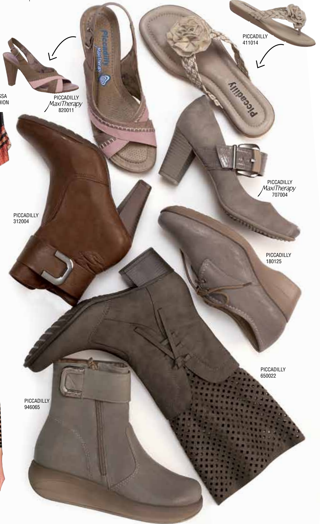
PICCADILLY MaxiTherapy 820011