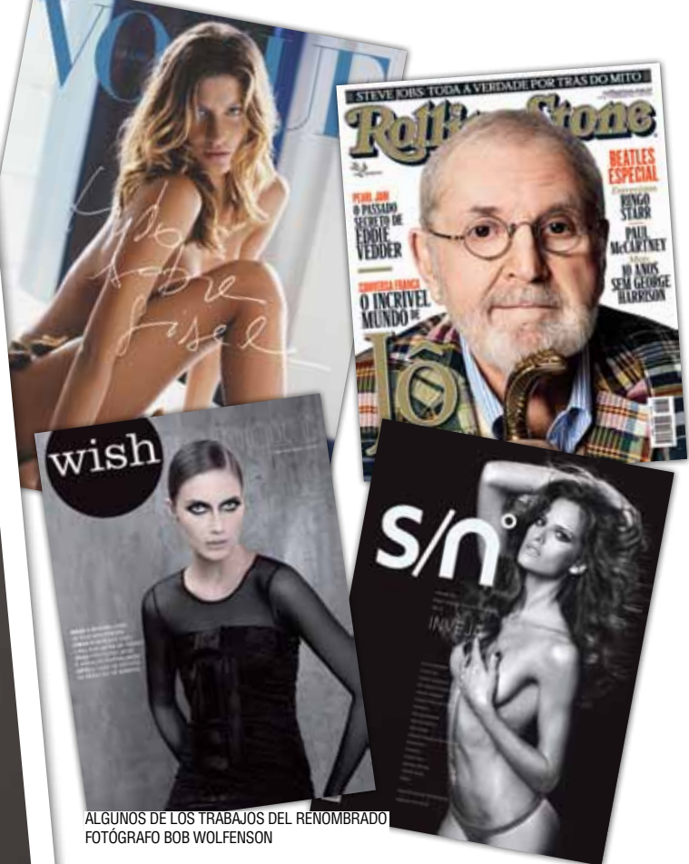
ALGUNOS DE LOS TRABAJOS DEL RENOMBRADO FOTÓGRAFO BOB WOLFENSON

Es uno de los fotógrafos más solicitados del mundo fashion y ya ha fotografiado a las principales tops, entre ellas a nadie menos que la brasileña Gisele Bündchen. Comenzó su carrera en la adolescencia trabajando como asistente de fotografía. Después de muchos trabajos como freelancer, en 1978 empezó su primer estudio. Su pasión por el arte de inmortalizar escenas lo llevó a vivir un año en Estados Unidos. Allí trabajó como asistente del fotógrafo norteamericano Bill King, una referencia en el mercado fashion. La experiencia internacional le abrió nuevas perspectivas de trabajo y a su regreso a Brasil se consagró como uno de los grandes nombres de la fotografía de moda y publicidad, teniendo a grandes marcas brasileñas como clientes, además de colaborar con