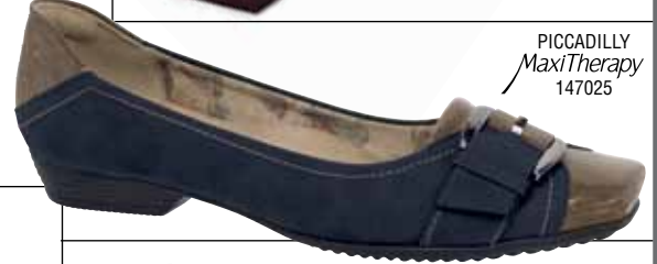
PICCADILLY MaxiTherapy 147025