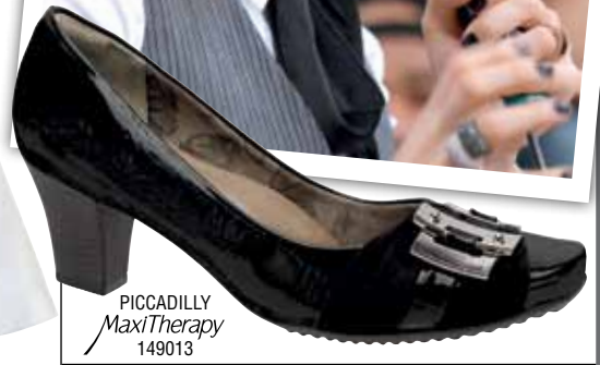
PICCADILLY MaxiTherapy 149013