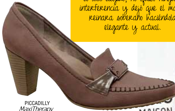
PICCADILLY MaxiTherapy 315034

Gwyneth Paltrow, famosa por su talento y charm en la alfombra roja, es una adepta del tono. En el look elegido, no quiso ninguna interferencia y dejó que el malva reinara soberano haciéndola elegante y actual.