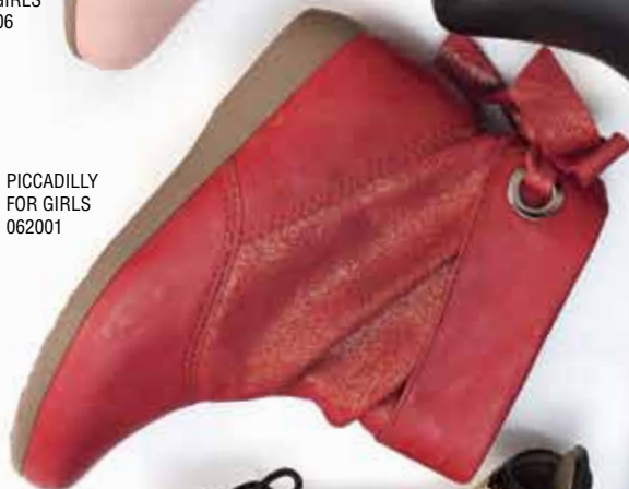
PICCADILLY FOR GIRLS 062001