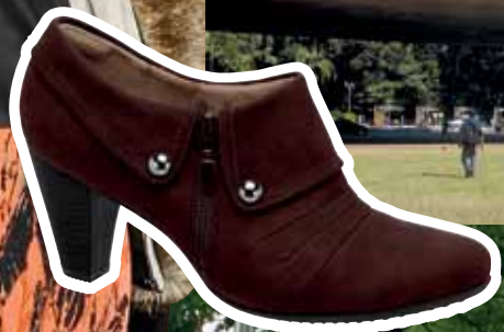
PICCADILLY MaxiTherapy 640040