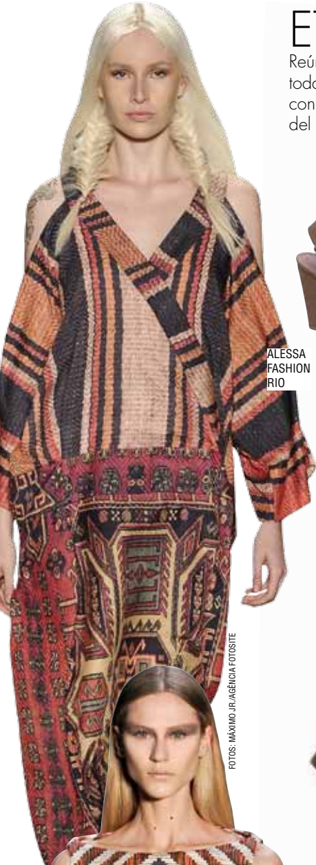
ALESSA FASHION RIO

Reúne referencias a África, Perú, China, India y Marruecos. Mézclalas todas en una licuadora. El resultado será la tendencia étnica-salvaje con pinceladas rústicas y artesanales que invade la estación más fría del año. ¡Abusa del estilo!