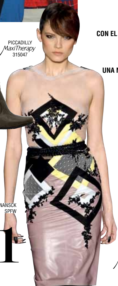
SAMUEL CIRNANSCK SPFW