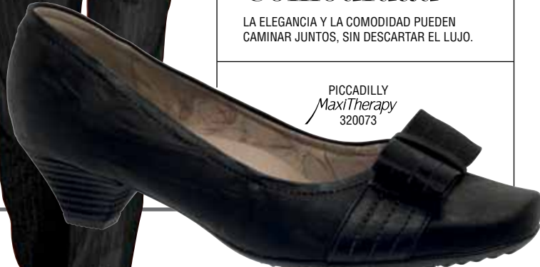
PICCADILLY MaxiTherapy 320073

LA ELEGANCIA Y LA COMODIDAD PUEDEN CAMINAR JUNTOS, SIN DESCARTAR EL LUJO.