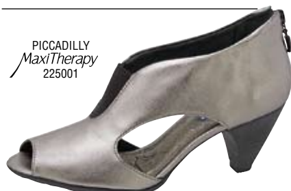
PICCADILLY MaxiTherapy 225001