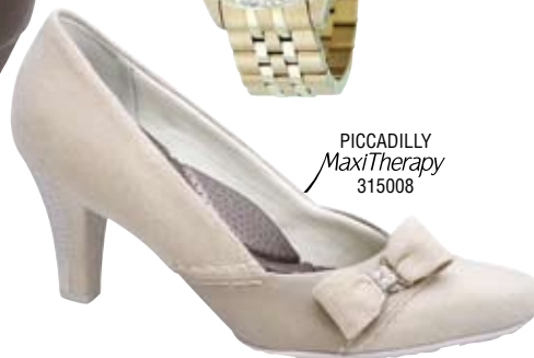
PICCADILLY MaxiTherapy 315008