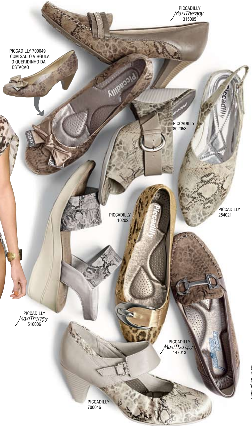
PICCADILLY MaxiTherapy 315005