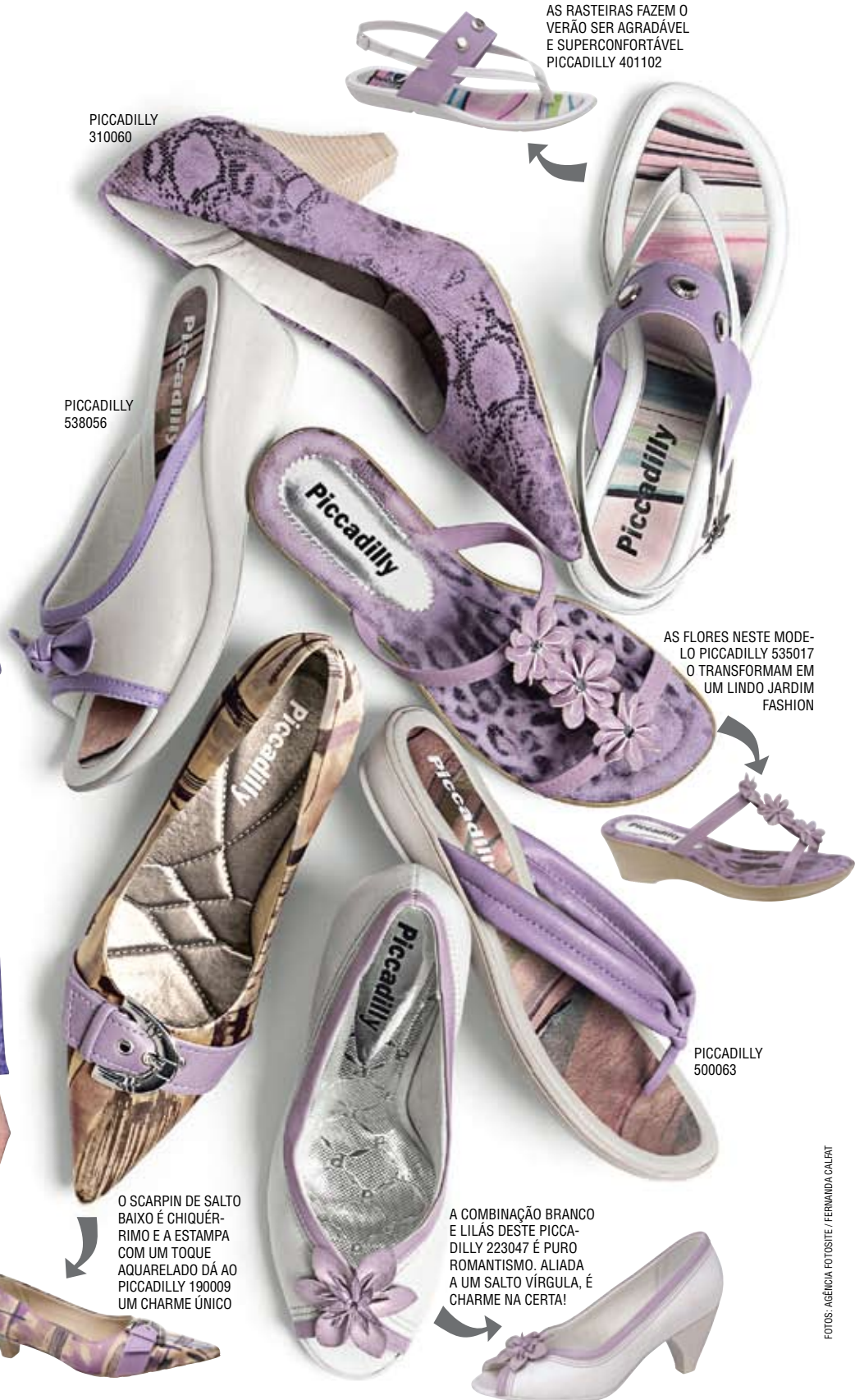
AS RASTEIRAS FAZEM O VERÃO SER AGRADÁVEL E SUPERCONFORTÁVEL PICCADILLY 401102