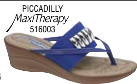
PICCADILLY MaxiTherapy 516003