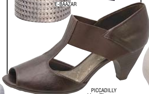
PICCADILLY MaxiTherapy 225004