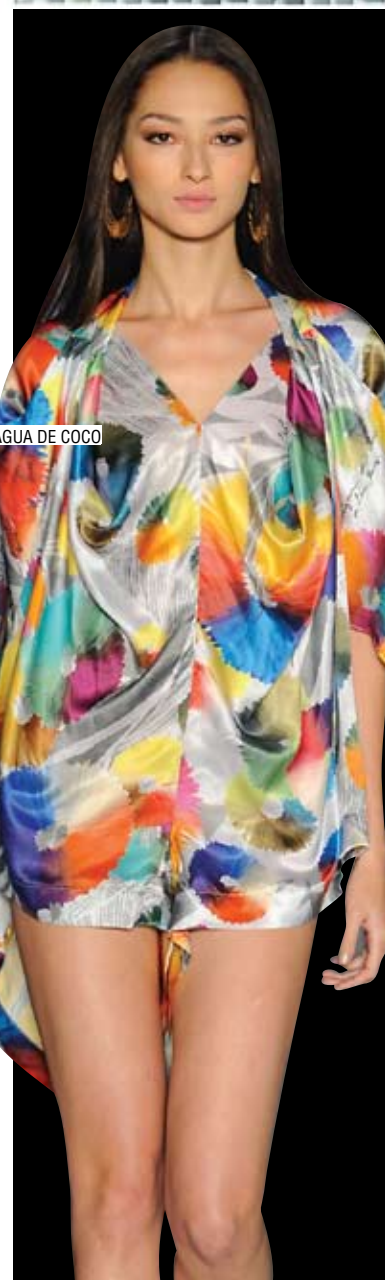
ÁGUA DE COCO

A PICCADILLY ESTÁ SEMPRE LIGADA NAS TENDÊNCIAS DO UNIVERSO FASHION. PROVA DISSO É A ESTAMPA AQUELADA DA NOVA COLEÇÃO QUE FALA PERFEITAMENTE COM O QUE FOI APRESENTADO NAS PASSARELAS