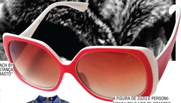
PEACH BY CONSTANÇA BASTO*