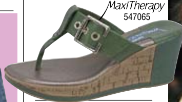
PICCADILLY MaxiTherapy 547065