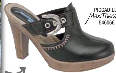
PICCADILLY MaxiTherapy 546066