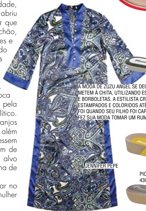
A MODA DE ZUZU ANGEL SE DECIFRA NO USO DE TECIDOS QUE REMETEM À CHITA. UTILIZANDO ESTAMPAS DE PÁSSAROS, FLORES E BORBOLETAS. A ESTILISTA CRIAVA MUITOS VESTIDOS LONGOS, ESTAMPADOS E COLORIDOS ATÉ MEADOS DE MAIO DE 1971, POIS FOI QUANDO SEU FILHO FOI CAPTURADO PELA DITADURA, O QUE FEZ SUA MODA TOMAR UM RUMO MAIS SOMBRIO

Assista ao filme "Zuzu Angel", que traz Patrícia Pillar no papel-título, e conheça mais sobre a história dessa mulher que projetou a moda brasileira no mundo.