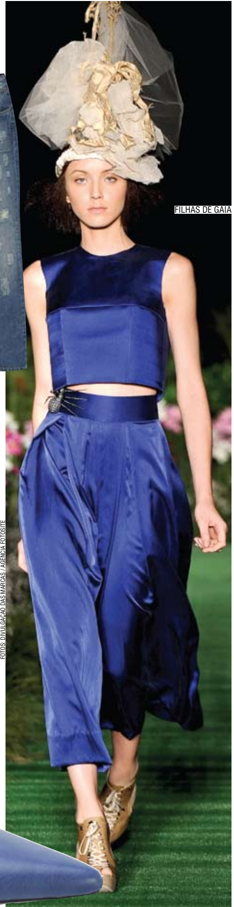
FILHAS DE GAIA