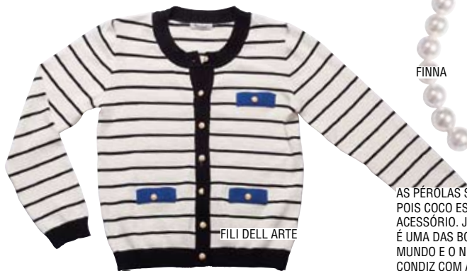
FILI DELL ARTE