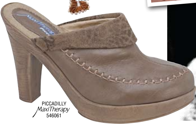
PICCADILLY MaxiTherapy 546061