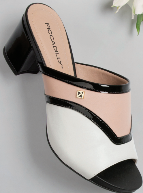
PICCADILLY SOFT STEP JUANETE 562017

FLORES Y COLORES EN ARMONÍA, TRAYENDO SUAVIDAD PARA UNA ESTACIÓN QUE ES TRADUCIDA EN TONOS CLAROS, MEZCLADOS CON OTROS MÁS OSCUROS