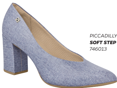
PICCADILLY SOFT STEP 746013

LAS HEBILLAS DAN UN AIRE ESPECIAL A LA PIEZA. MEZCLAR EL JEANS CON ALGO MÁS REBUSCADO ES UNA BUENA OPCIÓN.