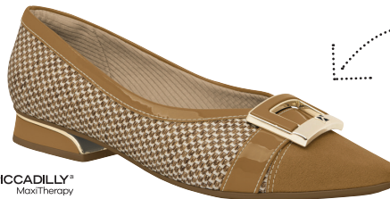
PICCADILLY ® MaxiTherapy 278014

LOS TACONES BAJOS SON BUENAS OPCIONES PARA LOOKS ELEGANTES Y AL MISMO TIEMPO CON UN CAMINAR MUY AGRADABLE.