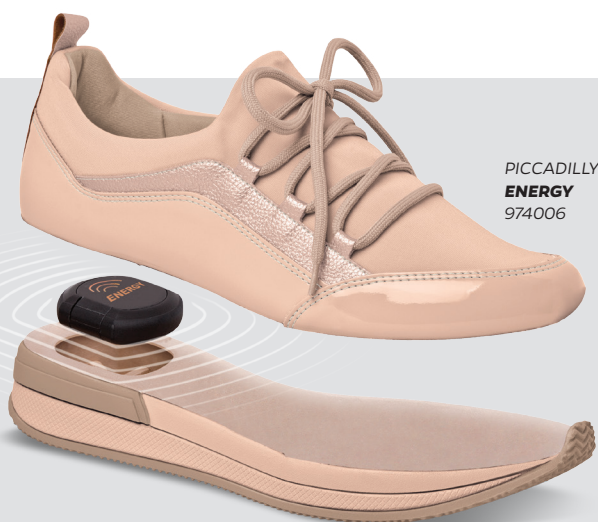
PICCADILLY ENERGY 974006

Es un conjunto de pequeños detalles, beneficios y tecnologías que hace que el calce de PICCADILLY sea incomparable. Los modelos cuentan con acabado suave, control de humedad y temperatura, estabilidad al caminar, ligereza y flexibilidad, medidas especiales y absorción de impacto, transformando un simple caminar en una experiencia única. ¡Es el famoso caminar sobre las nubes!