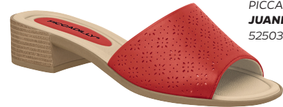
PICCADILLY JUANETE 525032

Los cortes láser transmiten refinamiento a las partes. La muestra de la piel trae sensualidad y también un estilo elegante.