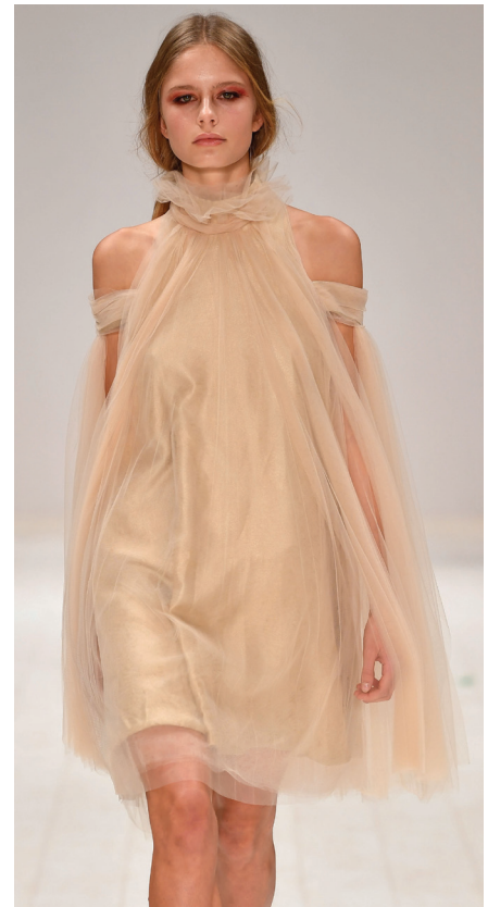
RAFFLES - MBFW