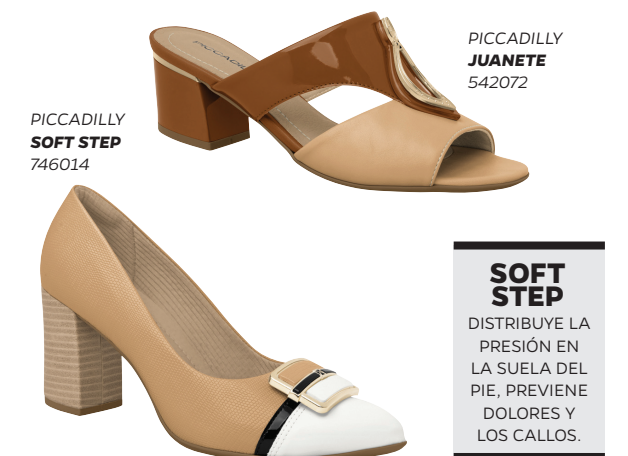
PICCADILLY SOFT STEP 746014