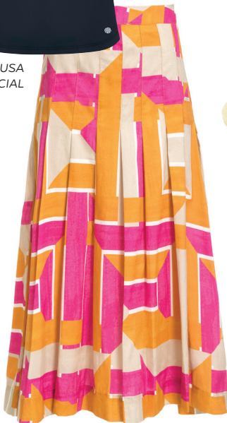
FALDA ÁGUA DE COCO