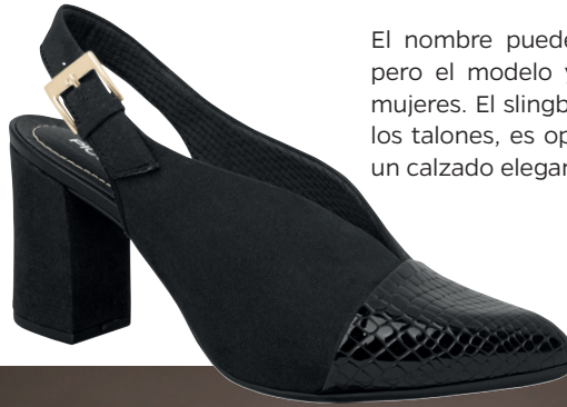
PICCADILLY SOFT STEP 746011

El nombre puede sonar un poco raro, pero el modelo ya es conocido de las mujeres. El slingback, con esa hebilla en los talones, es opción cuando se quiere un calzado elegante y delicado.