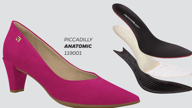
PICCADILLY ANATOMIC 119001

Los productos con la tecnología ANATOMIC respetan la anatomía y curvatura de los pies para mejor acomodarlos. El conjunto anatómico de la plantilla en la región del talón acomoda los pies de forma perfecta. Las suelas de los zapatos son muy resistentes al desgaste, y aumenta la durabilidad.