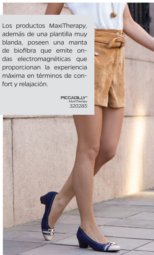
PICCADILLY® MaxiTherapy 320285

Los productos MaxiTherapy, además de una plantilla muy blanda, poseen una manta de biofibra que emite ondas electromagnéticas que proporcionan la experiencia máxima en términos de confort y relajación.