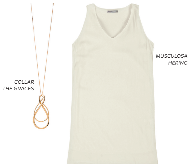
COLLAR THE GRACES

Siempre con looks simple, con superposiciones de piezas más sofisticadas