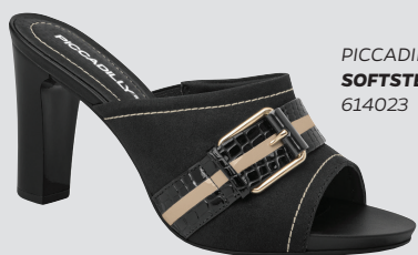
PICCADILLY SOFTSTEP 614023

En los modelos de tacón, la amortiguación se concentra en la parte frontal donde hay una gran fricción, en los productos más bajos, la amortiguación puede concentrarse en el talón o en toda la superficie de la plantilla.