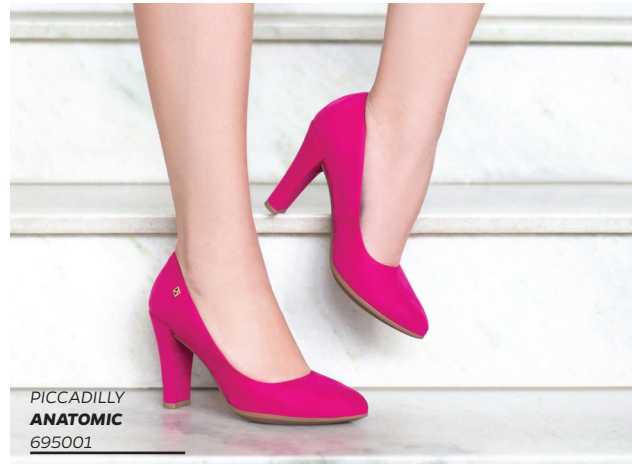
PICCADILLY ANATOMIC 695001

EL COLOR ROSA SIEMPRE GANA FUERZA EN LAS ESTACIONES MÁS CALIENTES DEL AÑO. CONOCIDO TAMBIÉN COMO FUCSIA, EL COLOR COMBINA EN TOTAL LOOK O CON COLORES SOBRIOS O MÁS ALEGRES.