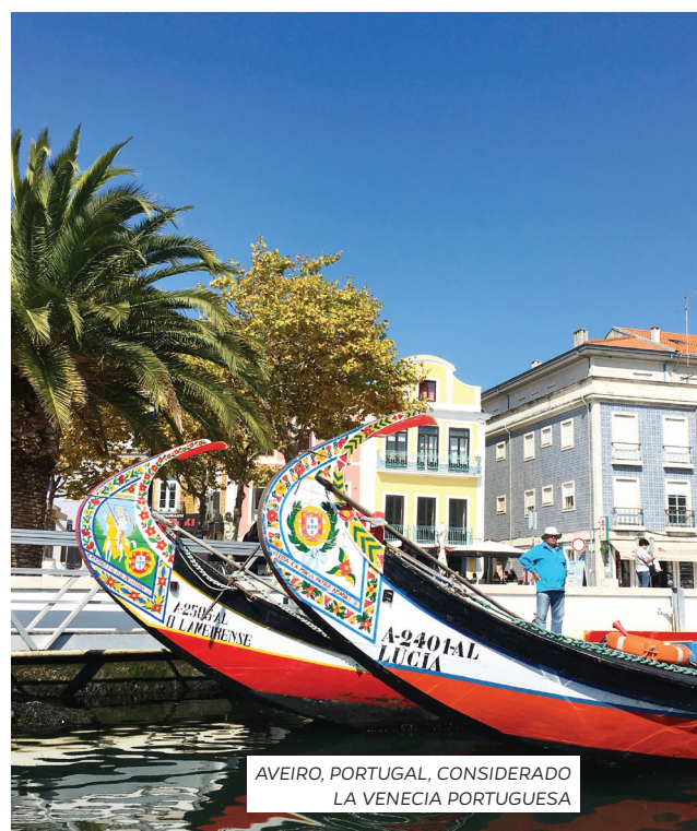
AVEIRO, PORTUGAL, CONSIDERADO LA VENECIA PORTUGUESA

A Praça do Comércio (La Plaza del Comercio) es