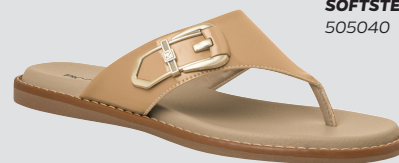
PICCADILLY SOFTSTEP 505040