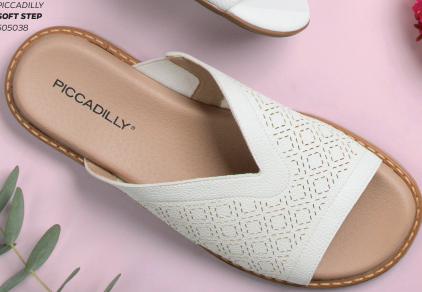
PICCADILLY SOFT STEP 505038