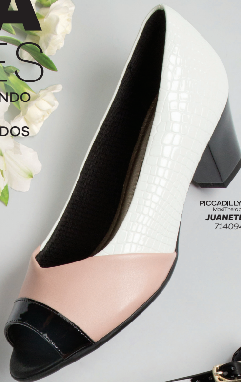
PICCADILLY® MaxiTherapy JUANETE 714094