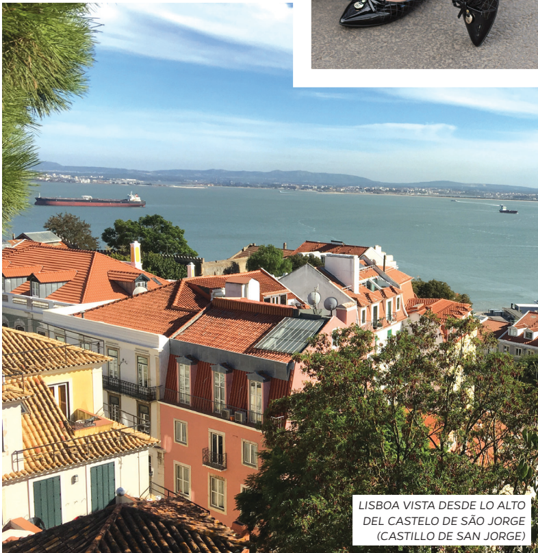
LISBOA VISTA DESDE LO ALTO DEL CASTELO DE SÃO JORGE (CASTILLO DE SAN JORGE)

considerada una de las más hermosas del mundo, y disfrutar de un buen vino. Ah, y cruzar por la Vila Nova de Gaia; la vista del Porto es hermosa.