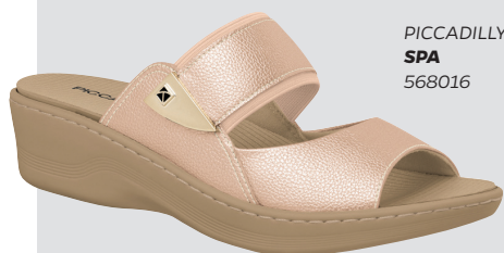
PICCADILLY SPA 568016

Los modelos SPA son exclusivos de PICCADILLY y vienen con dos plantillas para cambiar cuando lo desea: una masajeadora, que proporciona relajación en la planta del pie, y otra hidratante, con cápsulas de aloe vera que se rompen con la fricción del caminar, liberando una suave fragancia. Esto parece sueño, ¡pero es pura realidad!