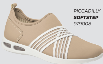
PICCADILLY SOFTSTEP 979008