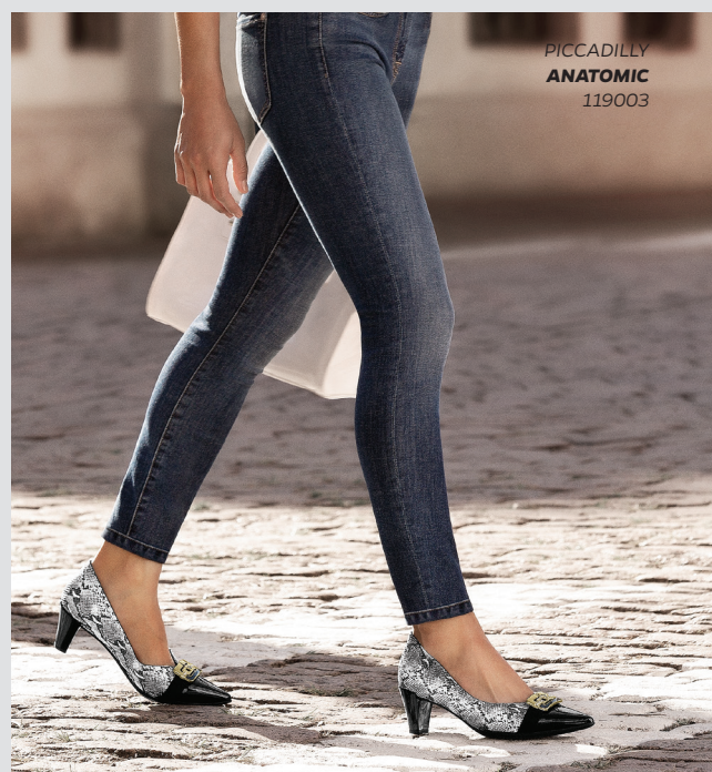
PICCADILLY ANATOMIC 119003

La parte frontal, por ser un poco más gruesa, posee cámaras de aire que absorben el impacto al caminar, disminuyendo los picos de presión y la percepción de las irregularidades del suelo. Parece complejo, ¡pero sólo tienes que probar para entender cómo es increíble!