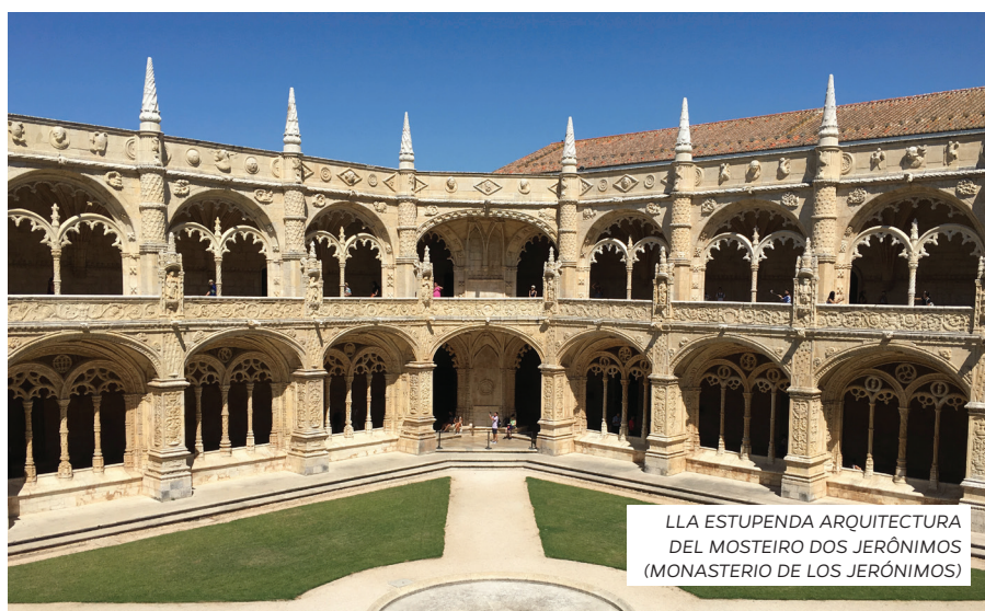
LLA ESTUPENDA ARQUITECTURA DEL MOSTEIRO DOS JERÓNIMOS (MONASTERIO DE LOS JERÓNIMOS)

PAÍS ENCANTADOR, COMIDA INCREÍBLE Y PUNTOS TURÍSTICOS DIGNOS DE UNA TARJETA POSTAL. ¡IMPOSIBLE NO SE APASIONAR!