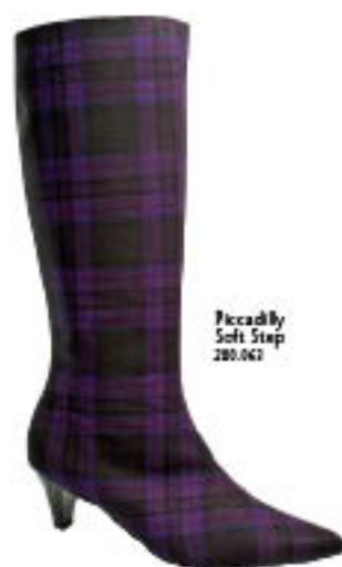
Piccadilly Soft Step 280.062