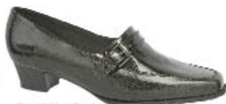
Piccadilly New Casual 218.101