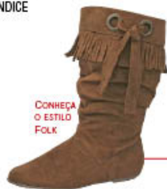
CONHEÇA O ESTILO FOLK