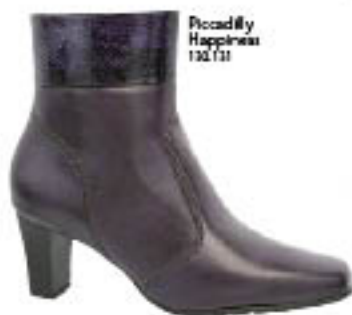
Piccadilly Happiness 130.131

As de cano curto combinam com minissaias e vestidos que deixam as pernas à mostra.