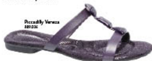
Piccadilly Venezia 889.036

Quando o tom é combinado com cores metálicas, como bronze, ouro e prata, o resultado é um look elegante e moderno. A cor uva também fica ótima para composições contrastantes: use com rosa, verde, cinza, branco e o clássico preto. ■