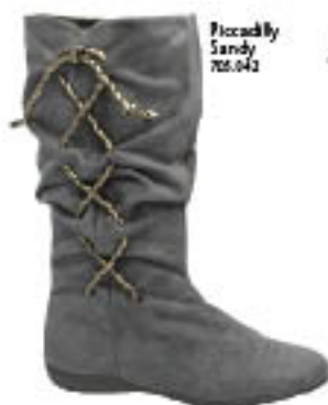
Piccadilly Sandy 702.042