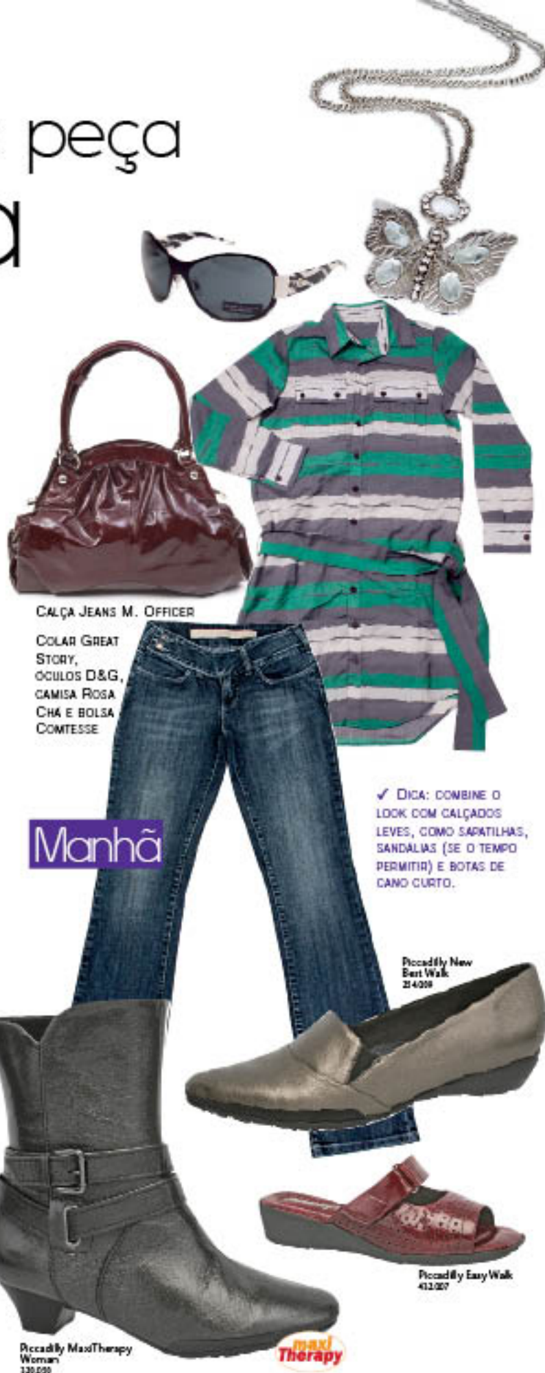
CALÇA JEANS M. OFFICER

Para começar o dia, aposte em cores claras e looks leves. A camisa listrada vai bem nos dias com temperaturas mais amenas (sabe aquele que sai um solzinho?), e se estiver bem frio, brinque com as sobreposições com blusinhas por baixo ou casacos por cima. Garanta o estilo sem passar frio ou calor, afinal, o importante é você sentir-se bem.