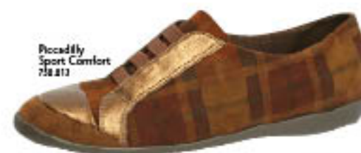
Piccadilly Sport Comfort 718.213

Quem disse que o que é perfeito não pode ficar ainda melhor? A grande novidade Piccadilly do inverno são os tênis com salto anabela, que são esportivos e casuais sem perder o glamour de estar a alguns centímetros do chão.