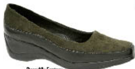
Piccadilly Fantasy 180.084