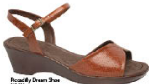
Piccadilly Dream Shoe 343.083