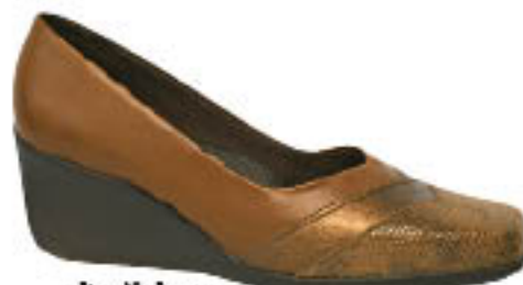
Piccadilly Poeme 232.024