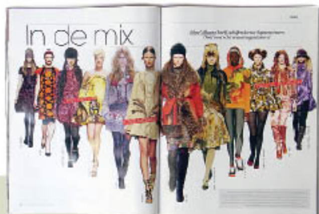
REVISTA ALEMÃ COM UMA SELEÇÃO DOS MELHORES LOOKS FOLK DA TEMPORADA!

Aproveite o inverno brasileiro, que não é tão rigoroso, para apostar no trio minivestido + meia-calça + bota sem salto