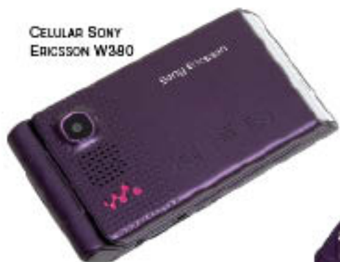
CELULAR SONY ERICSSON W390