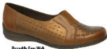
Piccadilly EasyWalk 412.002

Os modelos do tipo mocassim estão ensaiando sua volta triunfal à moda. Saia na frente e garanta o seu para a próxima estação.