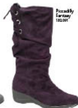
Piccadilly Fantasy 102.001