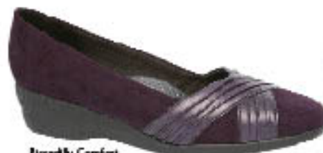
Piccadilly Comfort 210.004