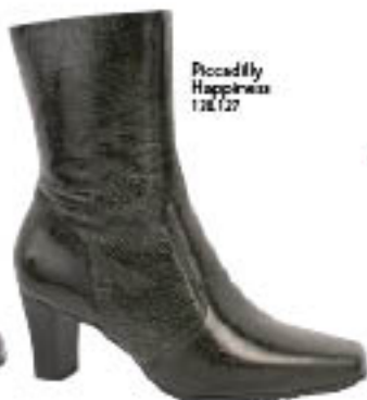
Piccadilly Happiness 120.127