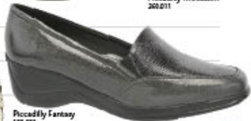
Piccadilly Fantasy 188.005