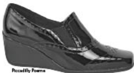
Piccadilly Poema 210.810