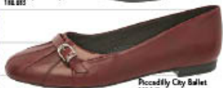
Piccadilly City Ballet 108.141