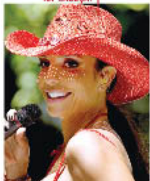
CONFIRA O QUE VEM NA CABEÇA!