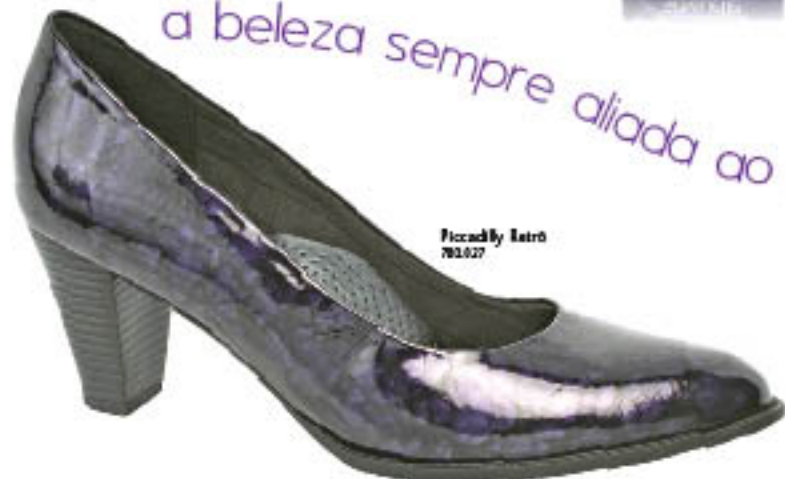
Piccadilly Retro 762.027