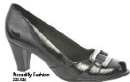
Piccadilly Fashion 222.026