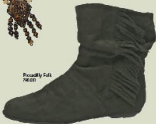
Piccadilly Folk 790.021

O folk não voltou de modo totalmente desencanado, ele retorna com grande estilo, sutileza e, o mais importante, com muito conforto. É hora de estar na moda e se sentir bem. Será fácil e delicioso abusar da tendencial