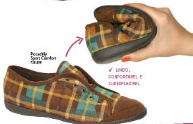
Piccadilly Sport Comfort 718.209