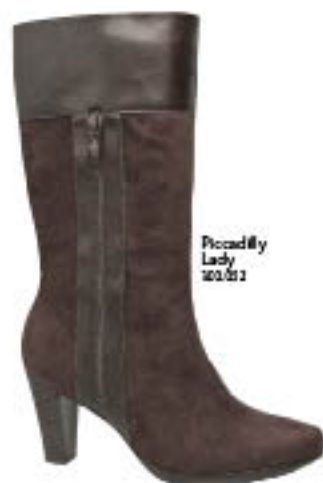
Piccadilly Lady 300.022

Fique nas alturas, com estilo e charme, usando as botas de cano longo. Aposte nas de montaria com jeans para o dia-a-dia e, para a noite, salto alto em look poderoso.