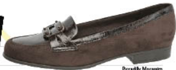
Piccadilly Moccasin 200.011