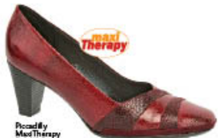
Piccadilly MaxiTherapy Soft Walk 240.022

✓ CUIDE DA SUA SAÚDE SEM DESCER DO SALTO