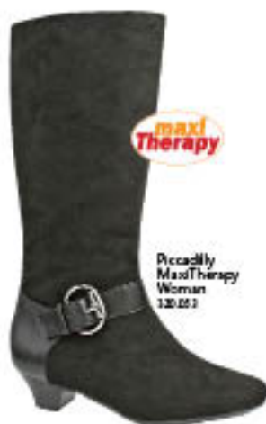
Piccadilly MaxiTherapy Woman 120.052