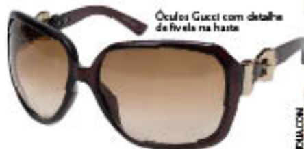
Óculos Gucci com detalhe de fivela na haste

✓ A TEXTURA CROCO (QUE IMITA A PELE DE CROCODILO) SERÁ HIT NO INVERNO. COM AS FIVELAS DE METAL, DEIXAR SEU LOOK MAIS ATUAL SERÁ IMPOSSIVEL.