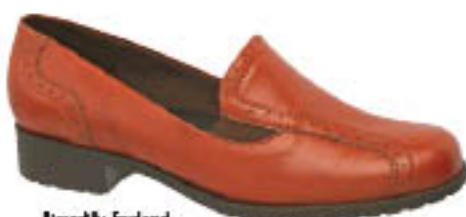
Piccadilly England 070.000