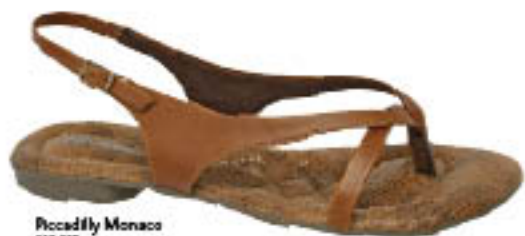
Piccadilly Monaco 802.828

Tecidos rústicos, camurça (principalmente nas botas), couro e veludo, além de tornarem sua roupa mais fashion, irão aquecê-la. Tachas, bordados e franjas darão um up no seu look.