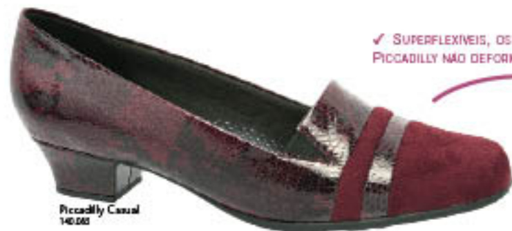
Piccadilly Casual 140.000

✓ SUPERFLEXÍVEIS, OS CALÇADOS PICCADILLY NÃO DEFORMAM