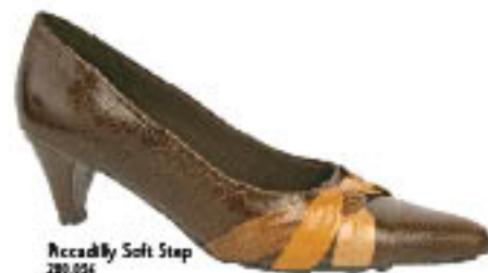
Piccadilly Soft Step 280.056