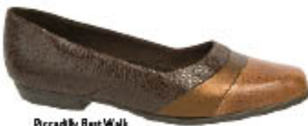
Piccadilly BestWalk 230.182