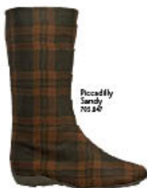
Piccadilly Sandy 702.040