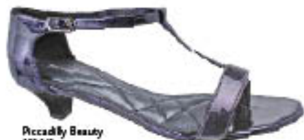
Piccadilly Beauty 882.048