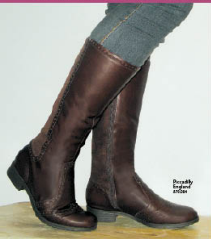
Piccadilly England 470.064