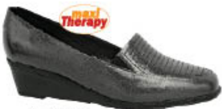
Piccadilly MaxiTherapy London 150.702