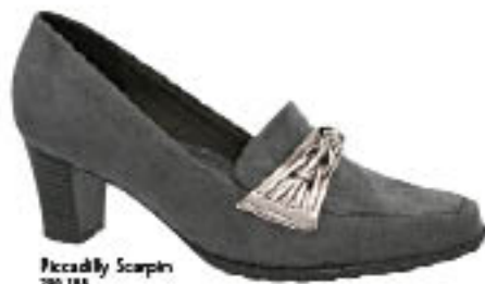
Piccadilly Scarpin 290.188