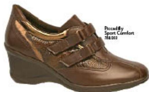
Piccadilly Sport Comfort 718.203