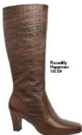
Piccadilly Happiness 110.020