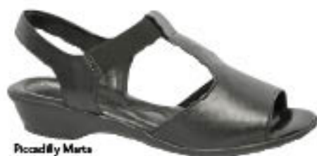
Piccadilly Marta 403.103