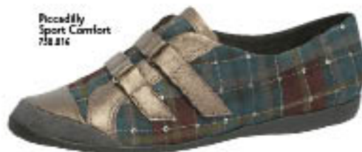
Piccadilly Sport Comfort 718.216