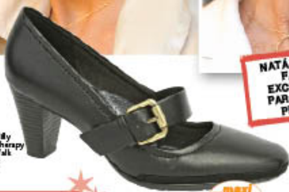
Piccadilly MaxiTherapy Soft Walk 240.021

NATÁLIA DO VALE FALA COM EXCLUSIVIDADE PARA AS AMIGAS PICCADILLY