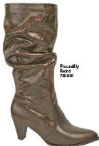
Piccadilly Retrô 700.030