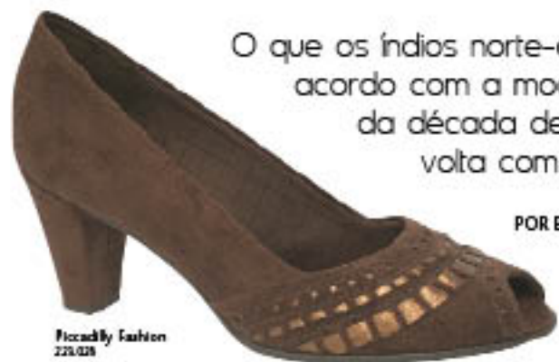
Piccadilly Fashion 229.028

O que os índios norte-americanos e os hippies têm em comum? De acordo com a moda, o estilo folk! O termo surgiu em meados da década de 1960, explodiu nos anos de 1970 e agora volta com força total, menos hippie e mais sofisticado