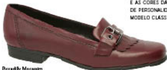
Piccadilly Mocassim 260.012

✓ MOCASSIM É SEMPRE UMA BELA OPÇÃO PARA DEIXAR QUALQUER LOOK MAIS ELEGANTE, A FIVELA E AS CORES DÃO O TOQUE DE PERSONALIDADE AO MODELO CLASSICO.