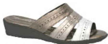
Piccadilly Easy Walk 412.016