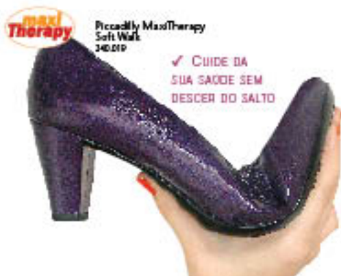
Piccadilly MaxiTherapy Soft Walk 240.019

✓ CUIDE DA SUA SAÚDE SEM DESCER DO SALTO