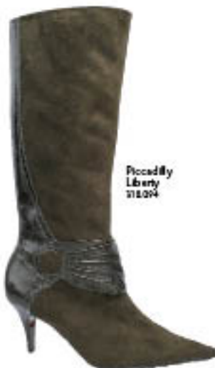
Piccadilly Liberty 218.024