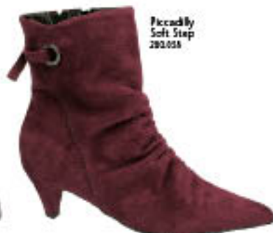
Piccadilly Soft Step 280.058