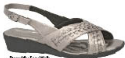
Piccadilly Easy Walk 418.017