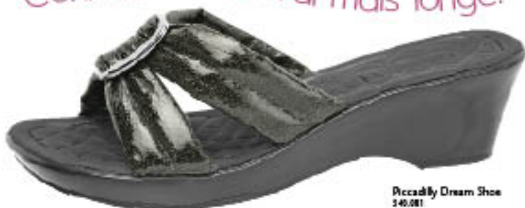
Piccadilly Dream Shoe 340.081