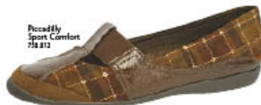
Piccadilly Sport Comfort 718.212