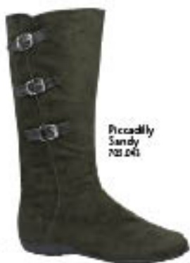
Piccadilly Sandy 702.041