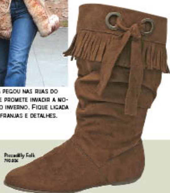
Piccadilly Folk 70.936

A MODA FOLK JÁ PEGOU NAS RUAS DO MUNDO INTEIRO E PROMETE INVADIR A MODA BRASILEIRA NO INVERNO. FIQUE LIGADA NAS CAMURÇAS, FRANJAS E DETALHES.