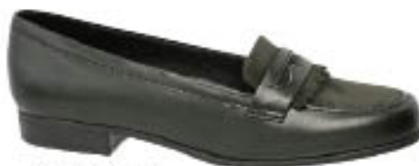
Piccadilly Mocassin 210.811