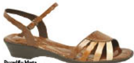
Piccadilly Marta 403.107