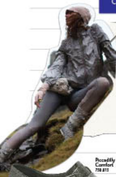
Piccadilly Sport Comfort 758.813

A moda Sport Comfort transmite um estilo casual e confortável, com modelagens detalhadas, velcros, elásticos, zíperes e cadarços. O contraste de cores e materiais dá um toque especial.