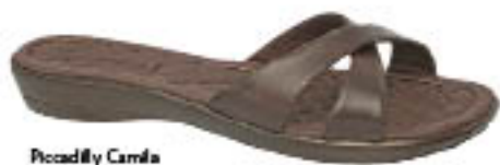
Piccadilly Camila 503.068