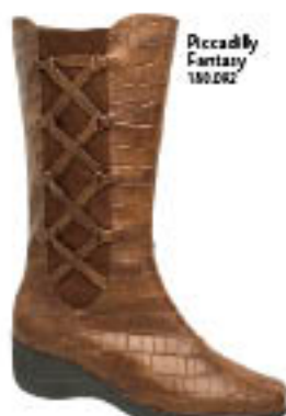
Piccadilly Fantasy 102.002

Canos baixos, médios ou longos! Seja qual for o comprimento, as botas ficam superbem com saias, vestidos e calças. Arrase e boa estação!