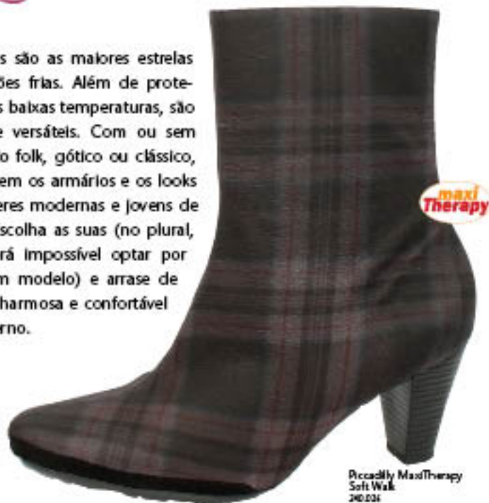
Piccadilly MaxiTherapy Soft Walk 240.036

As botas são as maiores estrelas das estações frias. Além de protegerem das baixas temperaturas, são estilosas e versáteis. Com ou sem salto, estilo folk, gótico ou clássico, elas invadem os armários e os looks das mulheres modernas e jovens de espírito. Escolha as suas (no plural, já que será impossível optar por apenas um modelo) e arrase de maneira charmosa e confortável nesse inverno.