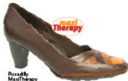
Piccadilly MaxiTherapy Soft Walk 240.034

Mesmo sobre saltos, os scarpins Piccadilly são superconfortáveis e podem ser usados sem moderação.