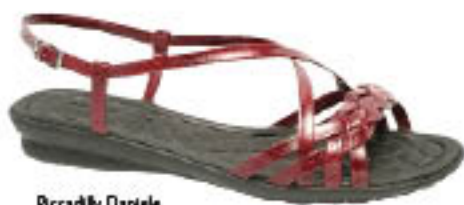
Piccadilly Daniele 481.082