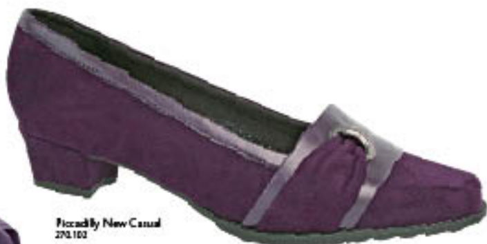
Piccadilly New Casual 270.102