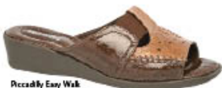
Piccadilly Easy Walk 432.089