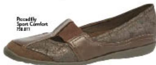
Piccadilly Sport Comfort 718.211

Quem disse que o que é perfeito não pode ficar ainda melhor? A grande novidade Piccadilly do inverno são os tênis com salto anabela, que são esportivos e casuais sem perder o glamour de estar a alguns centímetros do chão.