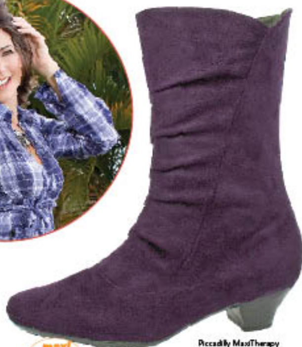
Piccadilly MaxiTherapy Woman 330.046