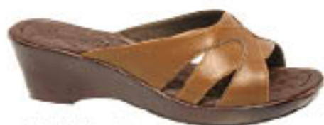
Piccadilly Dream Shoe 318.046