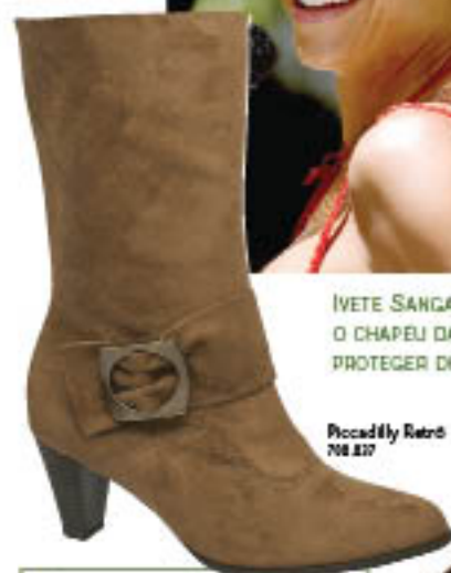
Piccadilly Retro 708.817

IVETE SANGALO APROVEITA O CHAPEU DA MODA PARA SE PROTEGER DO SOL.