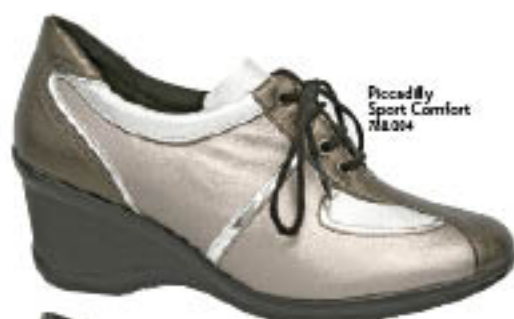
Piccadilly Sport Comfort 718.204

Atitude de sobra e jovialidade para aquelas que não abrem mão do estilo esportivo na sua rotina. Seja para estudar, bater perna ou namorar, surpreenda usando seus sapatênis em produções diversas com saias, calças e camisetas.