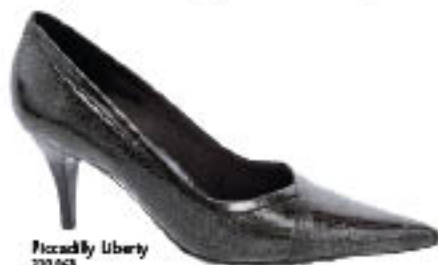
Piccadilly Liberty 210.048