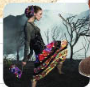
Piccadilly Folk 790.034

Uma mistura de culturas do mundo forma este novo estilo que invade as ruas nesta estação. Além de botas e franjas, fazendo referência ao velho oeste, acessórios, como lenços, faixas, cintos de couro e braceletes, são bem-vindos e arrematam o look.