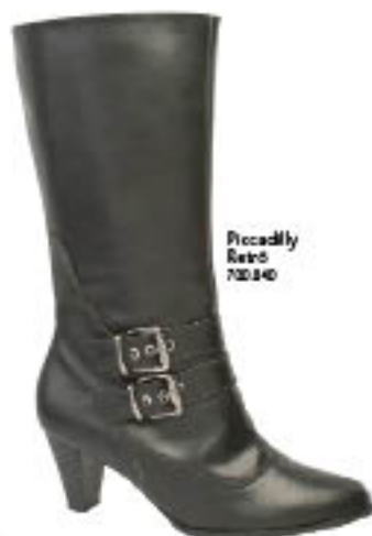
Piccadilly Retrô 700.040