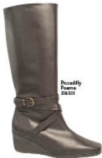
Piccadilly Poema 218.022

Fique nas alturas, com estilo e charme, usando as botas de cano longo. Aposte nas de montaria com jeans para o dia-a-dia e, para a noite, salto alto em look poderoso.