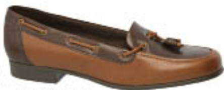
Piccadilly Mocassin 208.015