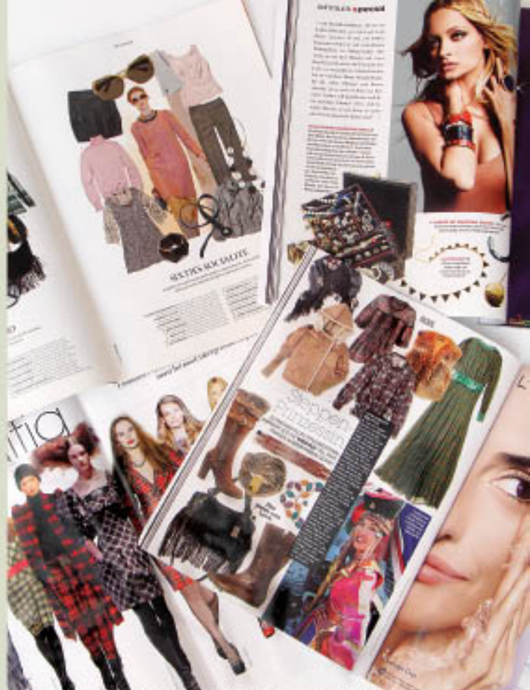
AS ETNAS INVADIRAM AS PÁGINAS DAS REVISTAS INTERNACIONAIS

persistiu até 2002, quando o folk estourou nas passarelas. Este ano, porém, os estilistas mostraram a releitura desse estilo que, apesar de ser composto por tecidos pesados, é mais suave e promete trazer mais elegância. Grifes, como Gucci, Cavalli e D&G, investiram nesse conceito e ressaltaram a feminilidade da mulher.