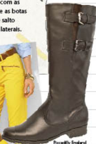
Piccadilly England 870.806