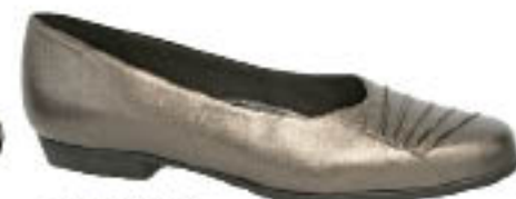
Piccadilly Best Walk 218.100