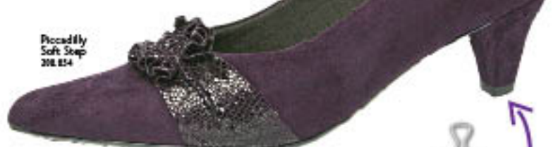
Piccadilly Soft Step 208.814