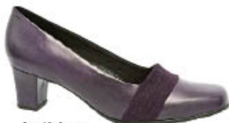
Piccadilly Scarpin 110.085