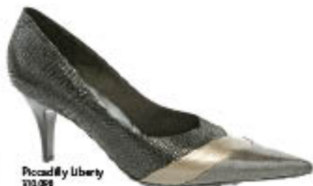
Piccadilly Liberty 210.098