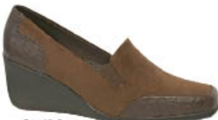
Piccadilly Poeme 230.034