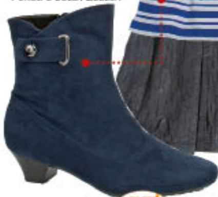
Piccadilly ModTherapy Woman 722.048