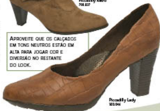
Piccadilly Lady 303.045

APROVEITE QUE OS CALÇADOS EM TONS NEUTROS ESTÃO EM ALTA PARA JOGAR COR E DIVERSÃO NO RESTANTE DO LOOK.