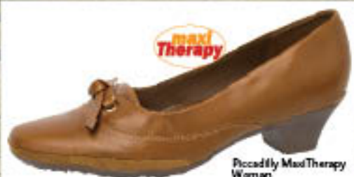
Piccadilly MaxiTherapy Woman 128.045