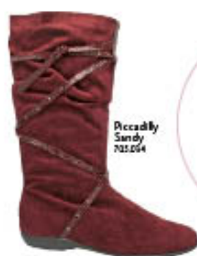
Piccadilly Sandy 702.054

abuse das meias grossas e cheias de detalhes