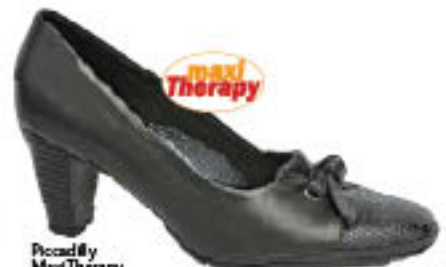
Piccadilly MaxiTherapy Soft Walk 240.022