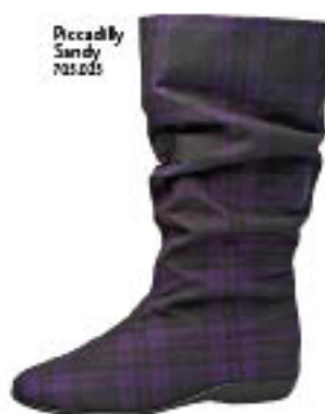
Piccadilly Sandy 702.025

abuse das meias grossas e cheias de detalhes