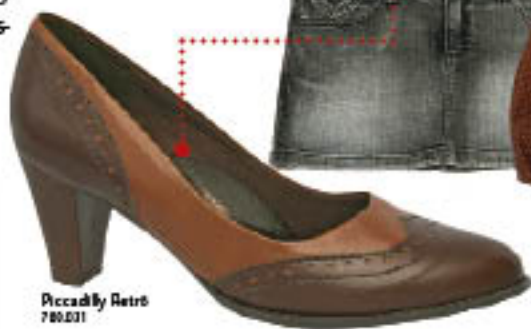
Piccadilly Retrô 70031