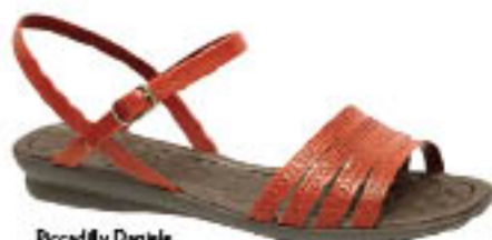
Piccadilly Daniele 401.091