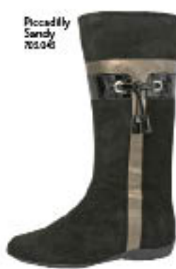
Piccadilly Sandy 702.045