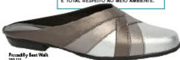
Piccadilly Best Walk 292.111

✓ TODOS OS MATERIAIS QUE VOCÊ VÊ NOS CALÇADOS PICCADILLY SÃO PRODUZIDOS COM 100% DE TECNOLOGIA E TOTAL RESPEITO AO MEIO AMBIENTE.