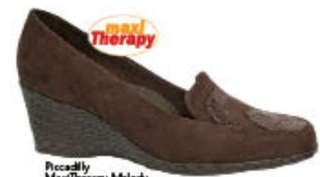
Piccadilly MaxiTherapy Melody 170.868

Os modelos do tipo mocassim estão ensaiando sua volta triunfal à moda. Saia na frente e garanta o seu para a próxima estação.