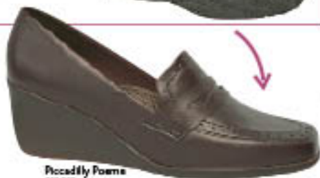
Piccadilly Poeme 218.028