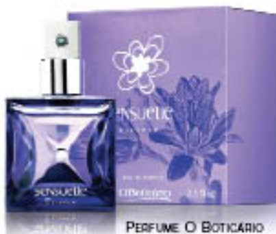
PERFUME O BOTICÁRIO