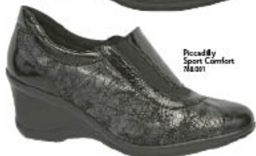
Piccadilly Sport Comfort 718.201