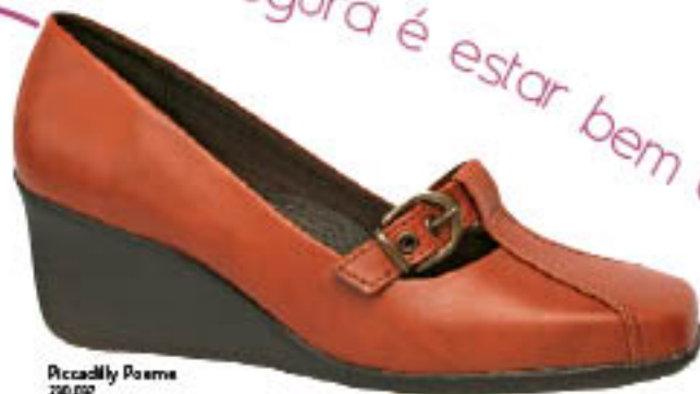
Piccadilly Poema 210.000