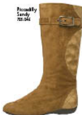
Piccadilly Sandy 702.046