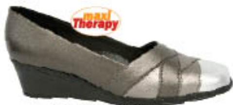
Piccadilly MaxiTherapy London 132.108