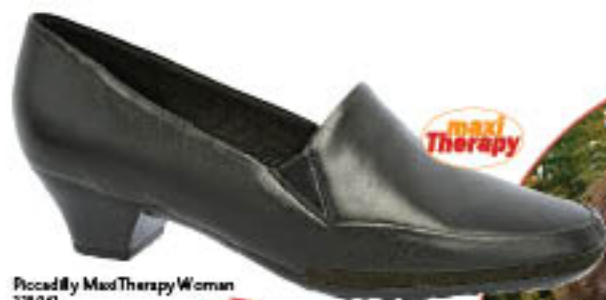
Piccadilly MaxiTherapy Woman 328.040