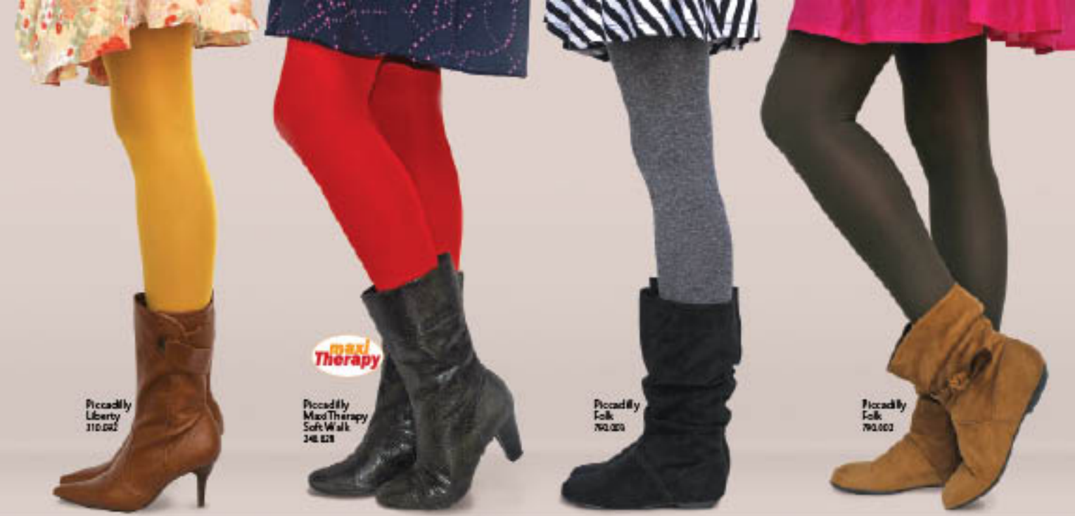
Piccadilly Liberty 310.002