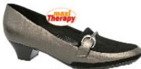
Piccadilly MaxiTherapy Woman 220.040