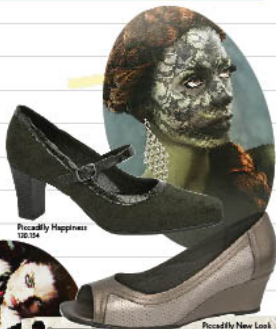
Piccadilly Happiness 120.154