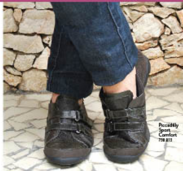
Piccadilly Sport Comfort 718.213