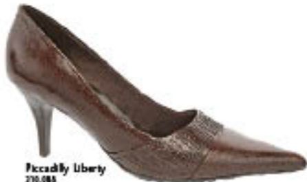
Piccadilly Liberty 210.088

Mesmo sobre saltos, os scarpins Piccadilly são superconfortáveis e podem ser usados sem moderação.