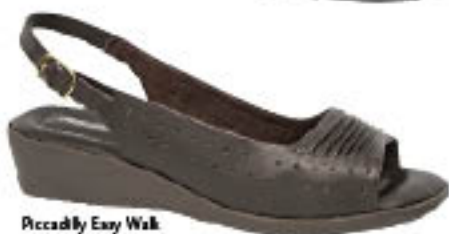
Piccadilly Easy Walk 430.036