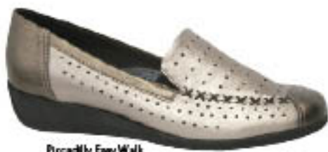
Piccadilly EasyWalk 412.001