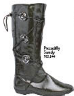
Piccadilly Sandy 702.044