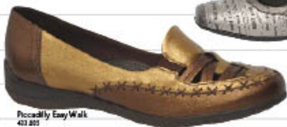
Piccadilly Easy Walk 403.001