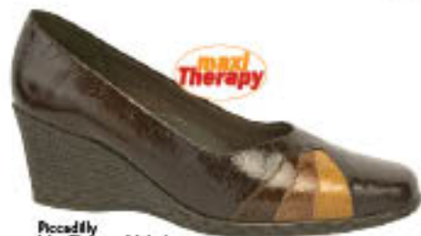
Piccadilly MaxiTherapy Melody 170.840