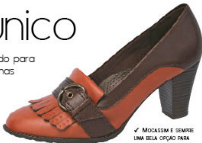
Piccadilly Fashion 228.870

Como não poderia deixar de ser, elas continuam presentes nos cintos. Mulheres magras ficam bem com todos os tipos de fivelas, das mais finas e discretas às grandes e chamativas. Já para quem está acima do peso, o ideal é evitar cintos com fivelas extravagantes. ■