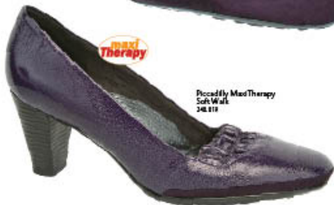
Piccadilly MaxiTherapy Soft Walk 348.818

✓ E PARA QUEM ACREDITA NO PODER DAS CORES, SEGUNDO A CROMOTERAPIA, TONALIDADES QUE VARIAM ENTRE O LILÁS E ROXO (E AÍ SE INCLUI A COR UVA) TÊM O DOM DE TRANSFORMAR, PURIFICAR E ESPIRITUALIZAR.