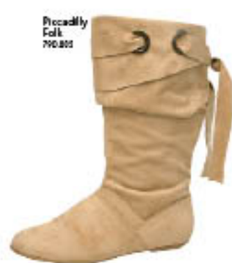
Piccadilly Folk 702.005