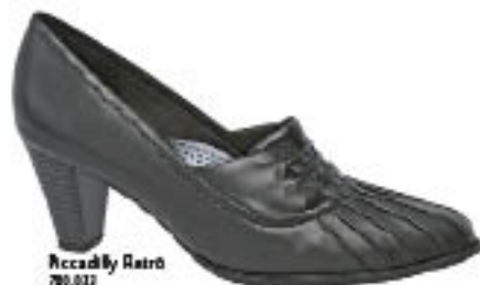
Piccadilly Rato 700.022