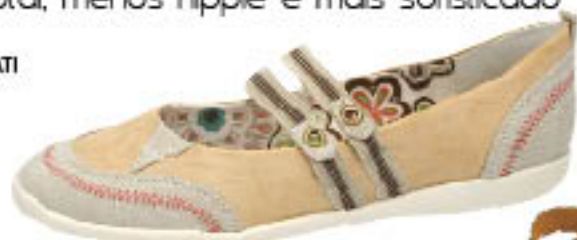
Piccadilly City Ballet 101.815

A inspiração no folk é tendência certa do próximo inverno. Esse é um termo, na moda, usado para definir um estilo adepto das peças étnicas, que fazem parte do folclore de determinadas culturas. Geralmente, é marcado por peças, acessórios e tecidos que compõem vestuários regionais, como franjas, couro, parkas, penas e mais uma variedade de detalhes, na maioria das vezes com pegadas artesanais. Entre as décadas de 60 e 70, o folk se inclinou para o hippie, no qual houve a junção dessas vestimentas com batas, calças boca-de-sino e sandálias rasteiras.