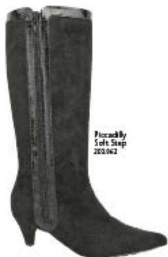
Piccadilly Soft Step 200.062