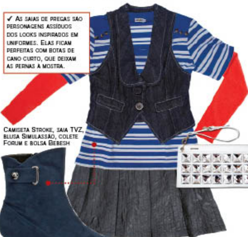
CAMISETA STROKE, SAIA TVZ, BLUSA SIMULASSÃO, COLETE FORUM E BOLSA BEBESH

✓ AS SAIAS DE PREGAS SÃO PERSONAGENS ASSÍDUOS DOS LOOKS INSPIRADOS EM UNIFORMES. ELAS FICAM PERFEITAS COM BOTAS DE CANO CURTO, QUE DEIXAM AS PERNAS A MOSTRA.